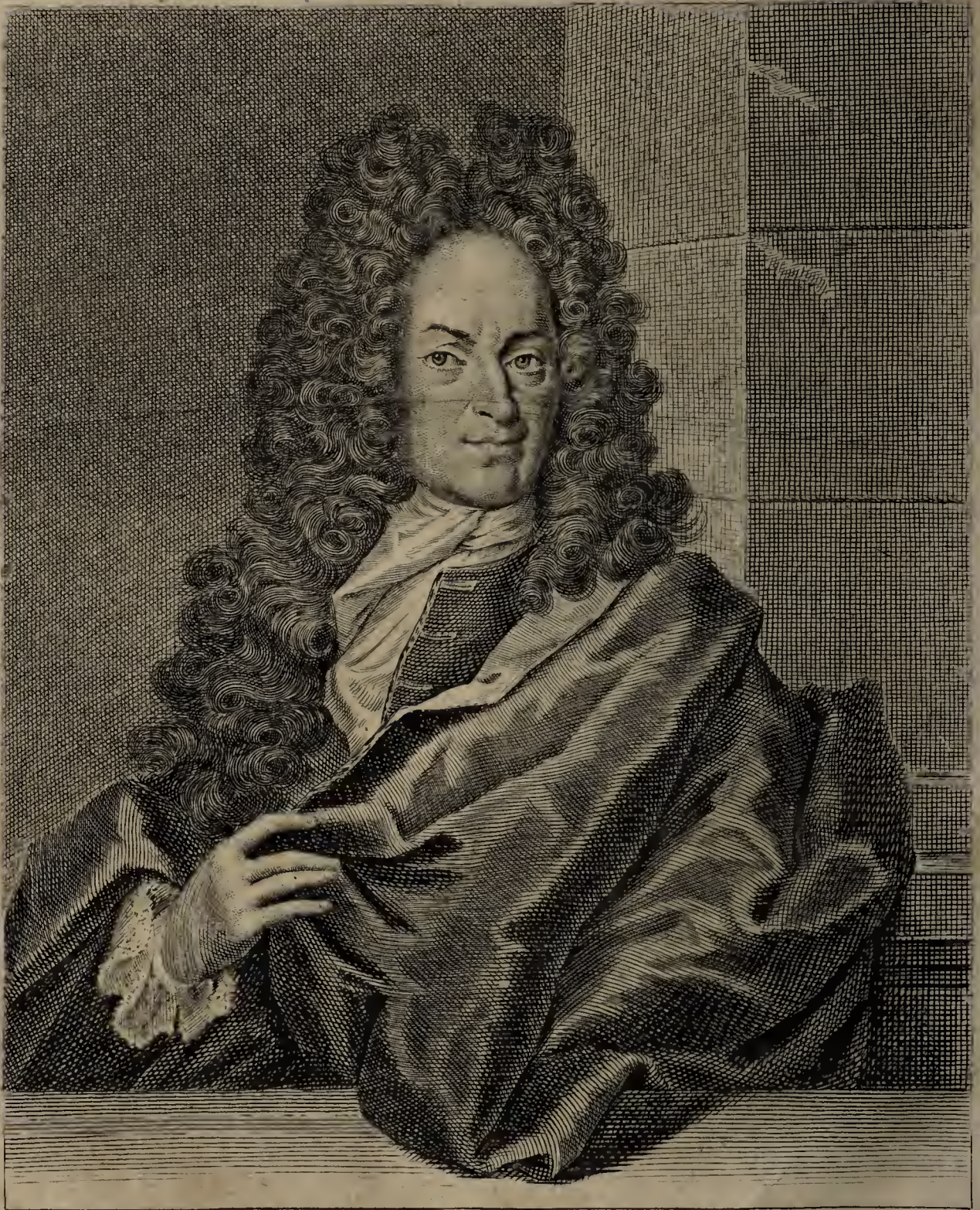
Georg Ernestus Stahl, Onoldo Francus, Med. Doct. h. t. Prof. Publ. Ord. Hall. —