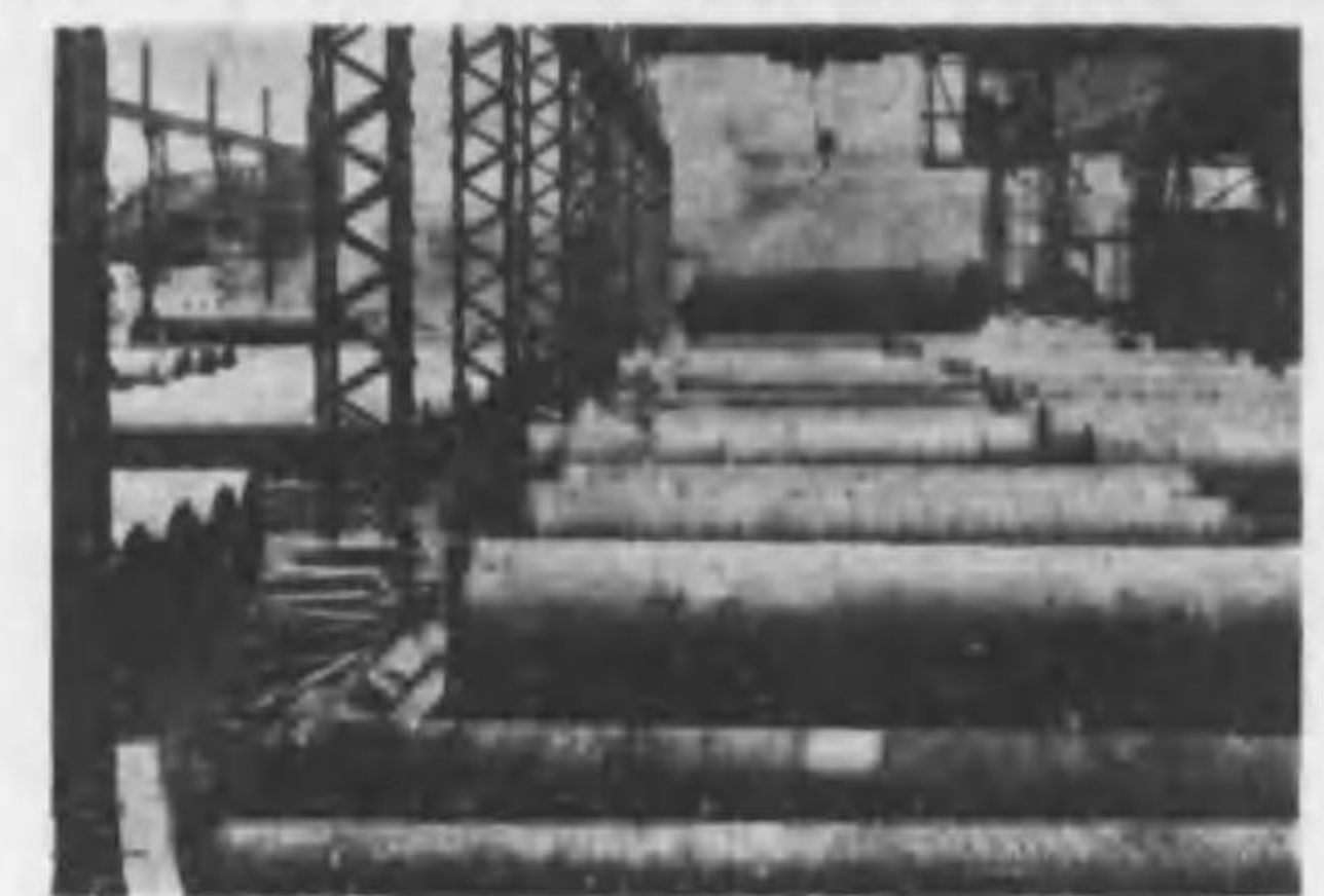
横濱市電氣銲接水道鋼管

各種船舶ノ建造、修理、汽機 汽罐、各種機械類、ポンプ 其他補助機械類、重油噴燃裝 置、ディーゼル機関、鐵塔、 鐵柱、鐵橋、タンク類、鐵骨 鐵構其他倉庫業一般