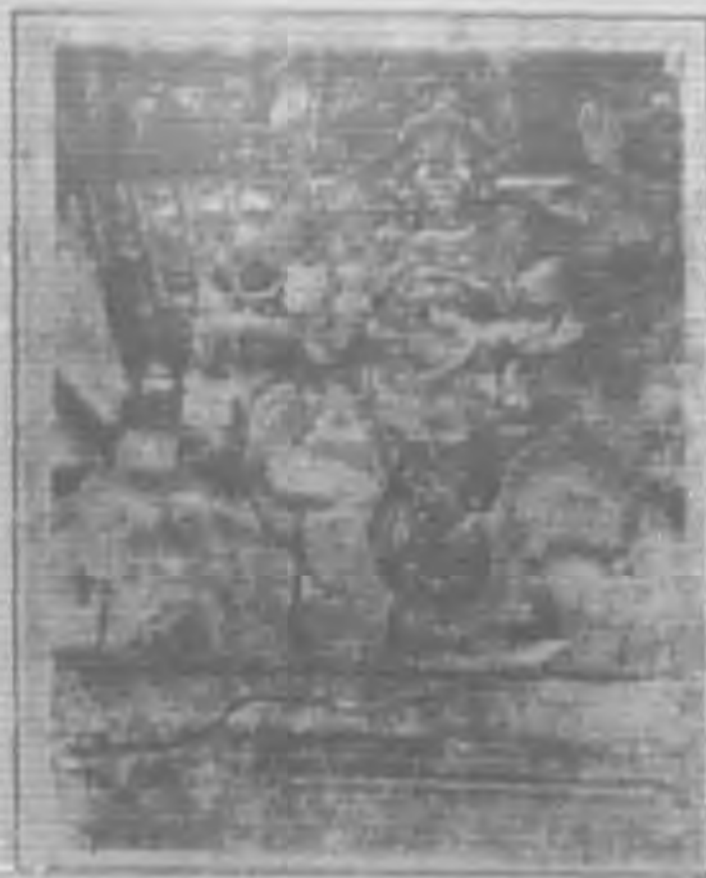
附圖： 昆明市西麻苴土主神塑像

又土主神六臂，各執一種法器，上兩臂一執日，一執月；前兩臂一執書卷，一執長戟；後兩臂一執金鈴，一執金印。似土主神不單是執掌農事，除毒害，(日、月、長戟、牛)也一樣的司鬼神(金鈴)，執掌教化(書卷)，和統治的事情(金印)。總之宇宙間的一切現象，原始社會的所有的事情，似乎土主神都執掌着。以一神而有着多方面的威靈，有着諸神所有的作用，或者也就是土主神的崇拜所以最爲普遍的一個最重要的原因。