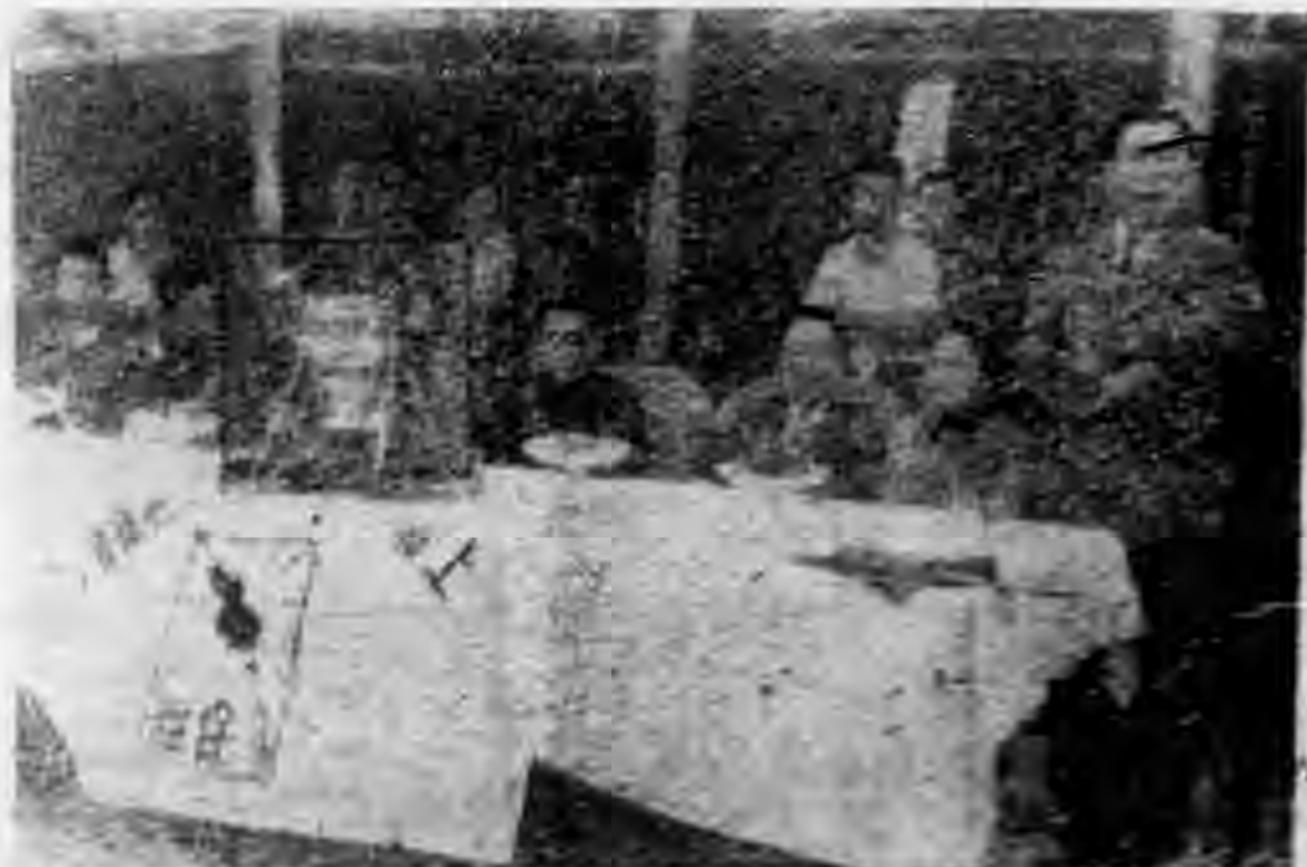
右圖，廿八年秋，本會