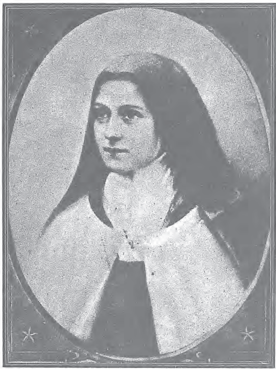
女修會衣聖了成撒肋德蘇耶孩嬰