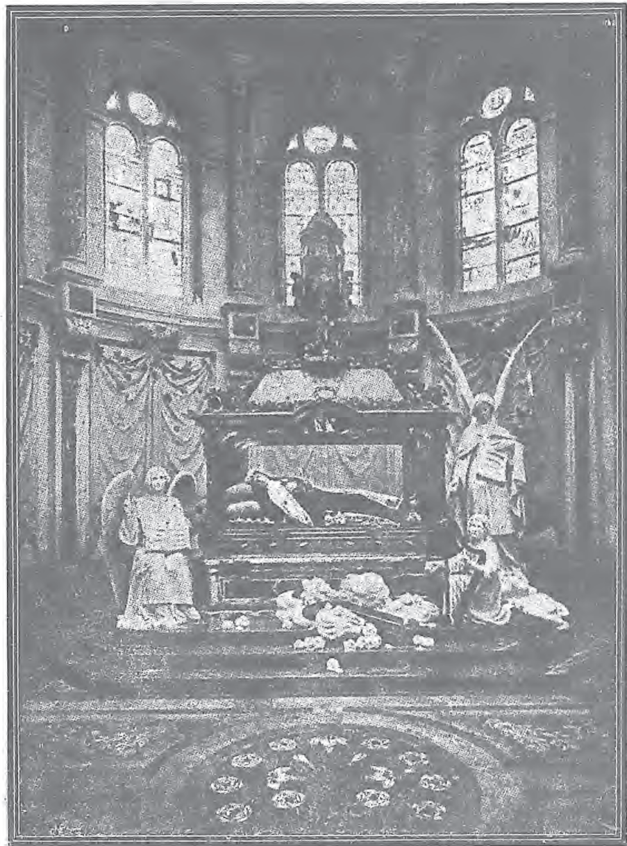
利西耳聖衣會修院內 敬聖女之小堂及聖髑寶龕