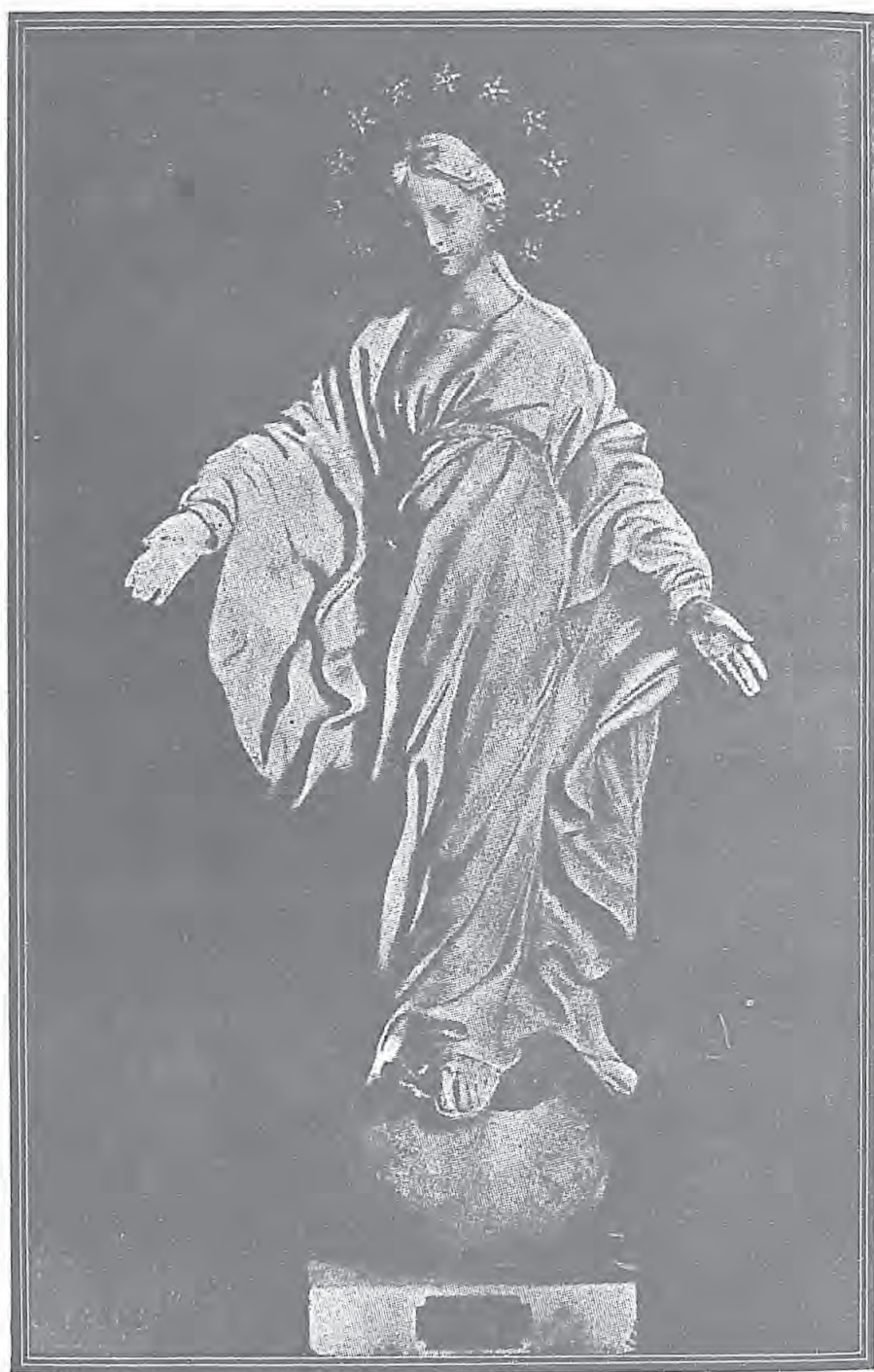
像母聖之病其好治時即並笑微撒肋德向