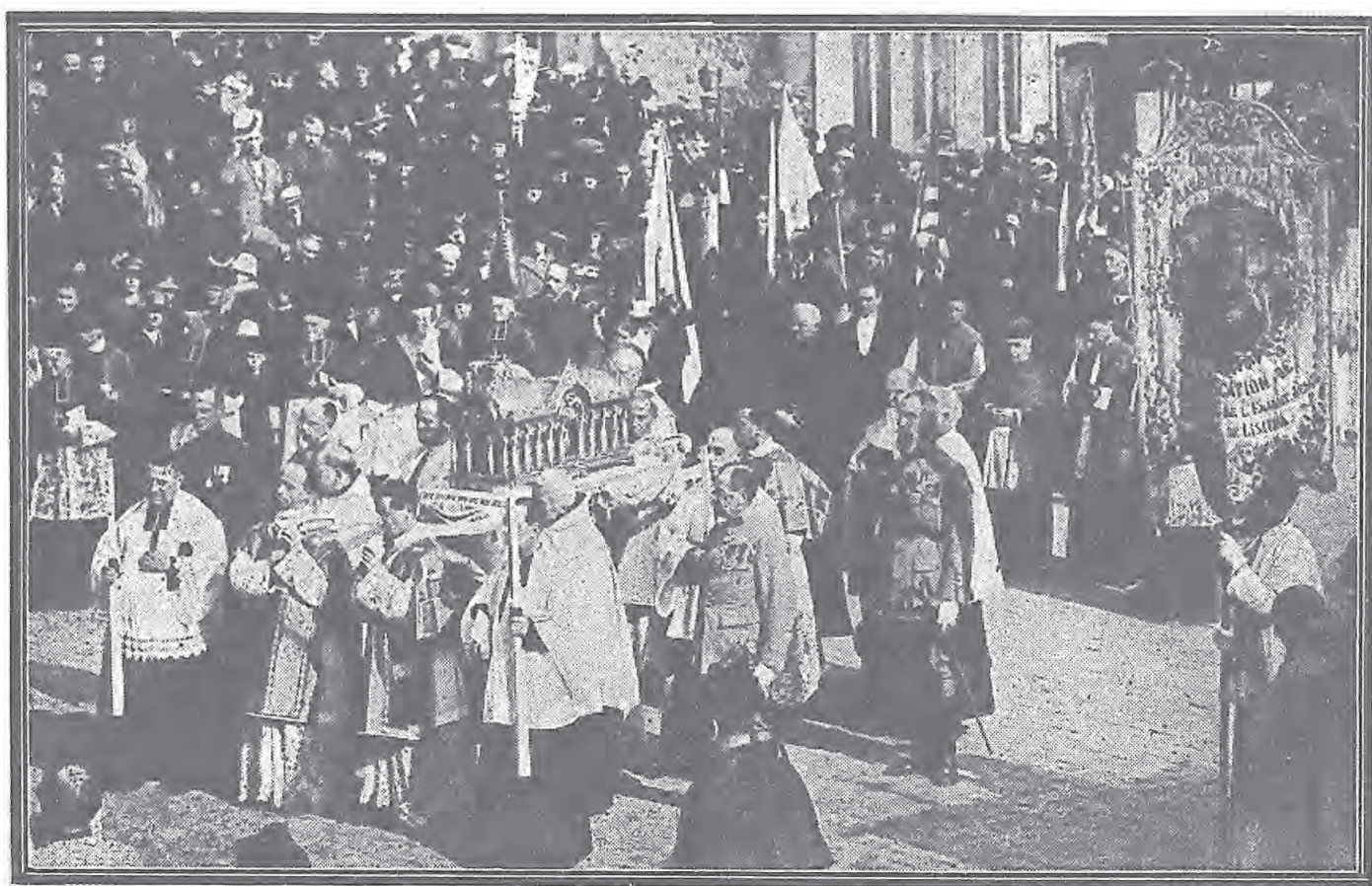
聖女髑髏抬行遊市開會歡迎