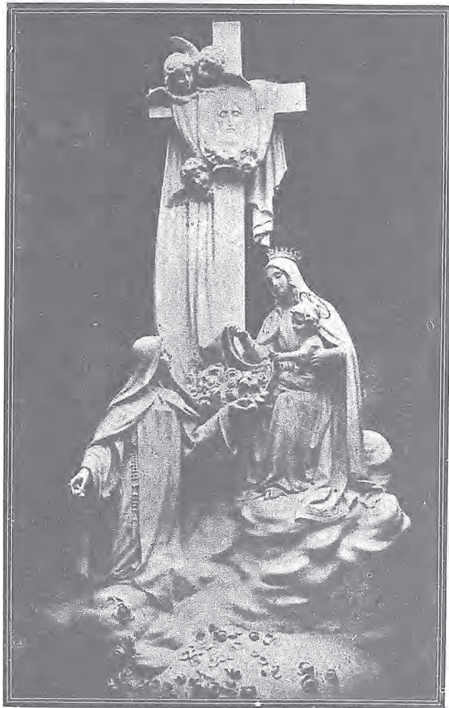
點雨如多地於瑰玫落天由撒肋德女聖