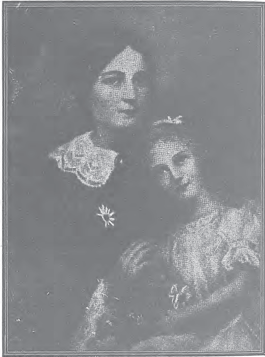
親母其及撒肋德蘇耶孩嬰