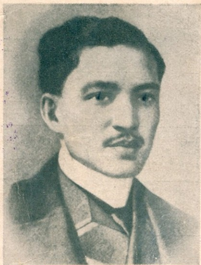
黎撒(Dr. José Rizal)—菲律賓之國父