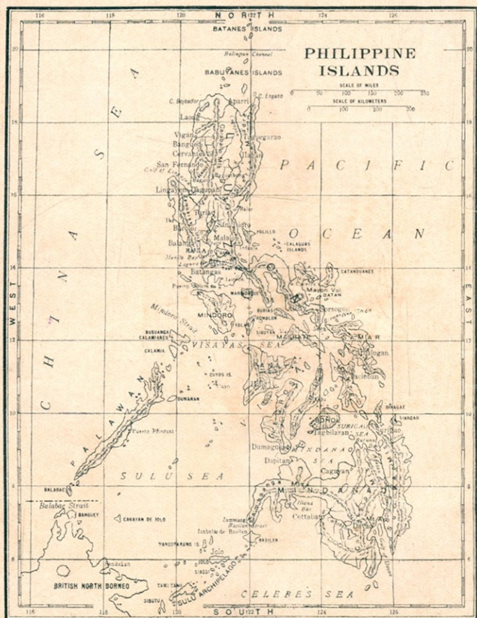
菲 律 賓 羣 島