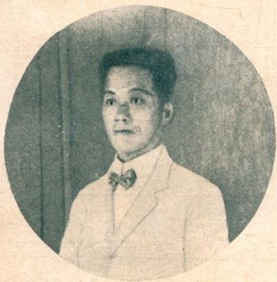
阿圭拉度(Emilio Aguinaldo)— 菲律賓共和國第一任大總統