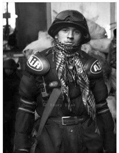
У мене взяв сорочку і не повернув.

Був руфером, зацепером, вивчав міські катакомби.