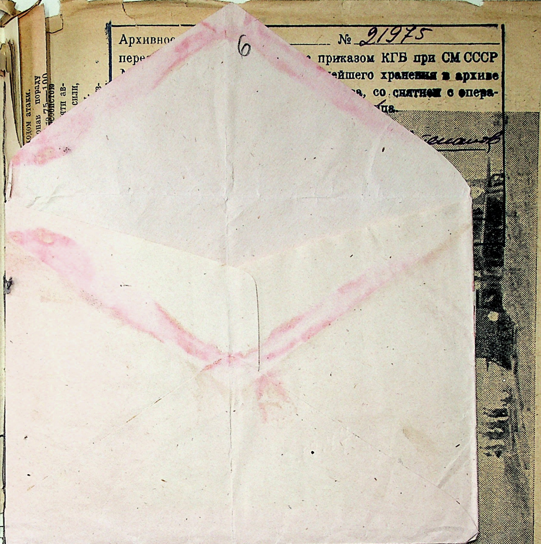
На Бадамівському вуглерозрізі встановлено потужний екскаватор 350. Вага всього агрегату 227 тонн. Екскаватор за добу знімає 7,000 квадратних метрів ґрунтового на носу на глибину 13 метрів. Екскаватор 350.