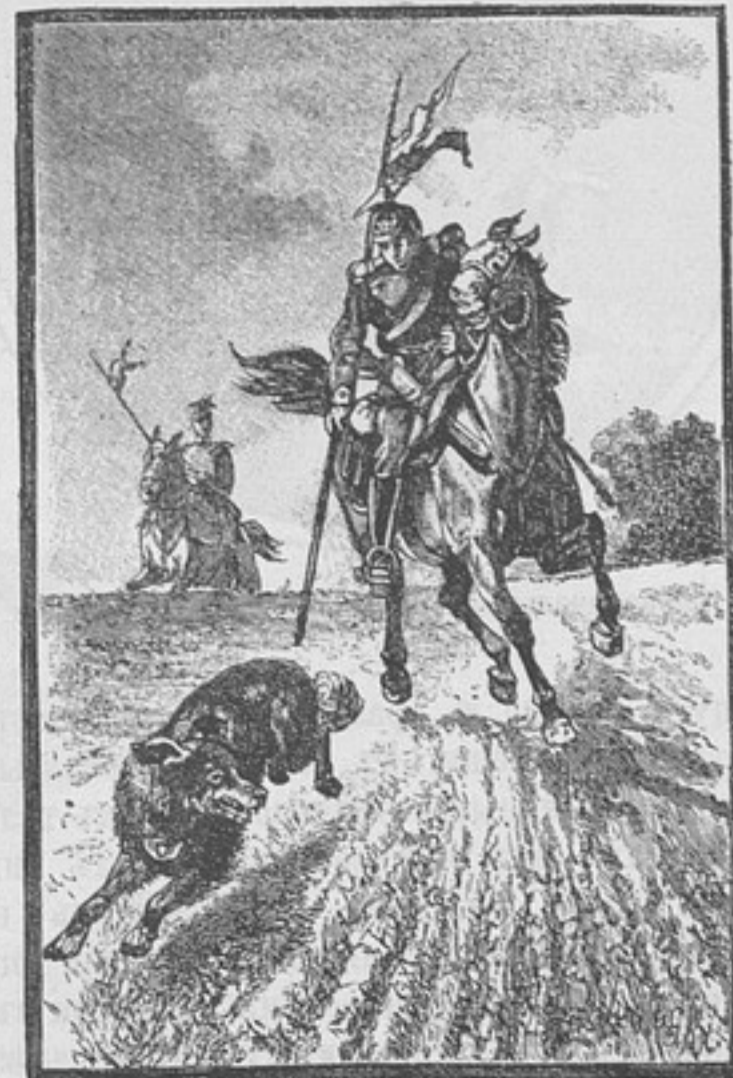
Германія: Кавалеристъ, преслѣдующій собаку съ донесеніями.

Обученіе основано на томъ принципѣ, что собака будетъ