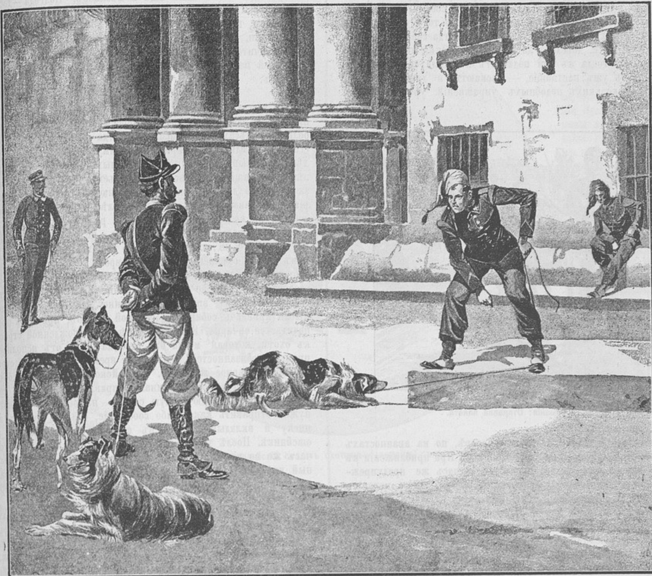
Италія: Дрессировка собакъ стрѣлками.

терпѣть жестокое обращеніе со стороны непріятели, и потому ей внушается полнѣйшее къ нему отвращеніе. Исходя отсюда,