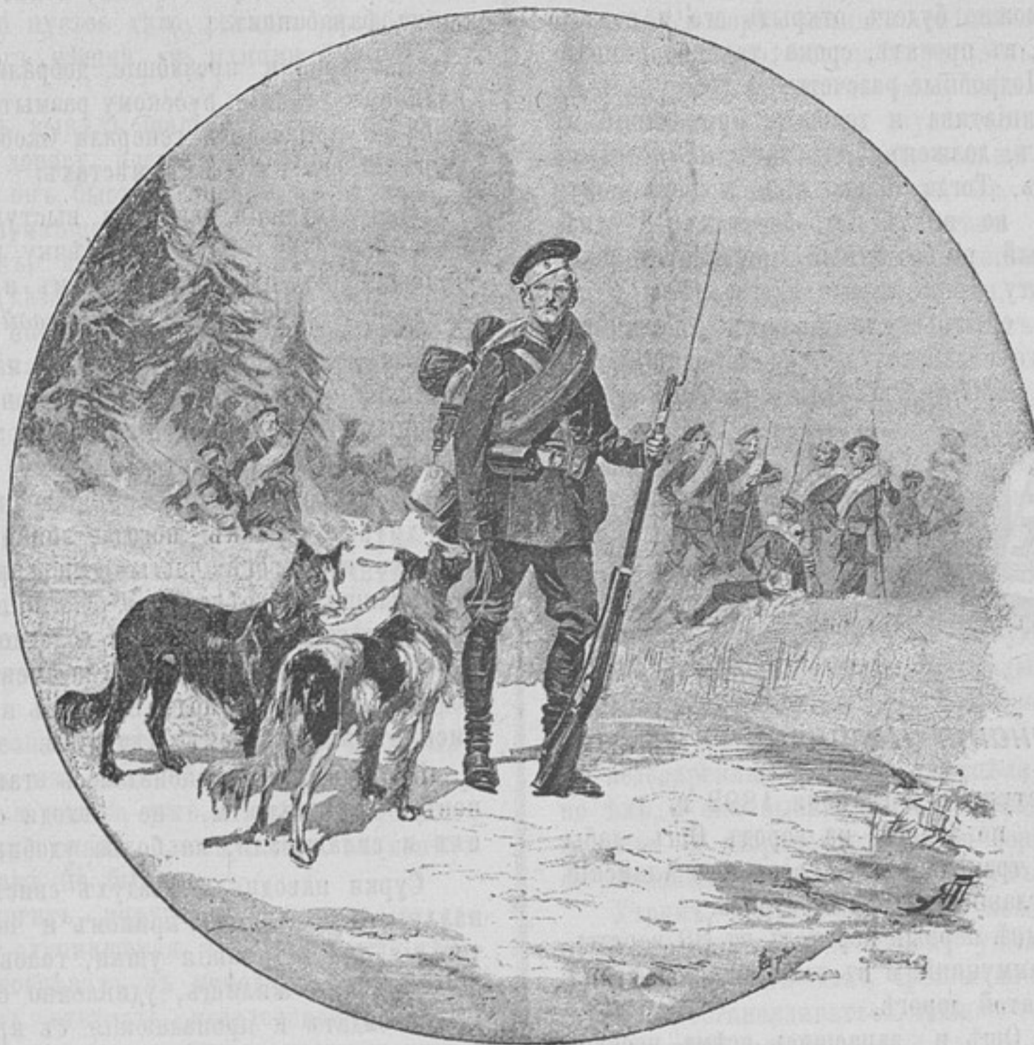
Россия: Русский гвардейскій солдатъ охотничьей команды съ военными собаками.

Потомъ, — преподавателями и воспитателями могли бы быть офицеры изъ болѣе свѣдущихъ и способныхъ, которые, сохраняя жалованье и всѣ преимущества коронной службы на педагогическомъ поприщѣ, пользовались бы, сверхъ того, развѣ только готовой квартирой. При мирномъ составѣ наши полки переполнены офицерами и подпоручиками, ждущими производства по 5—6 лѣтъ; такъ что можно было бы безъ всякаго ущерба для военного дѣла удѣлить часть наличныхъ силъ на воспитательное дѣло подростка молодого поколѣнія. Такія занятія, по моему, могли бы принести только пользу умственному развитію офицеровъ, безъ излишняго для нихъ обремененія и ущерба военной службы, если, по проше-