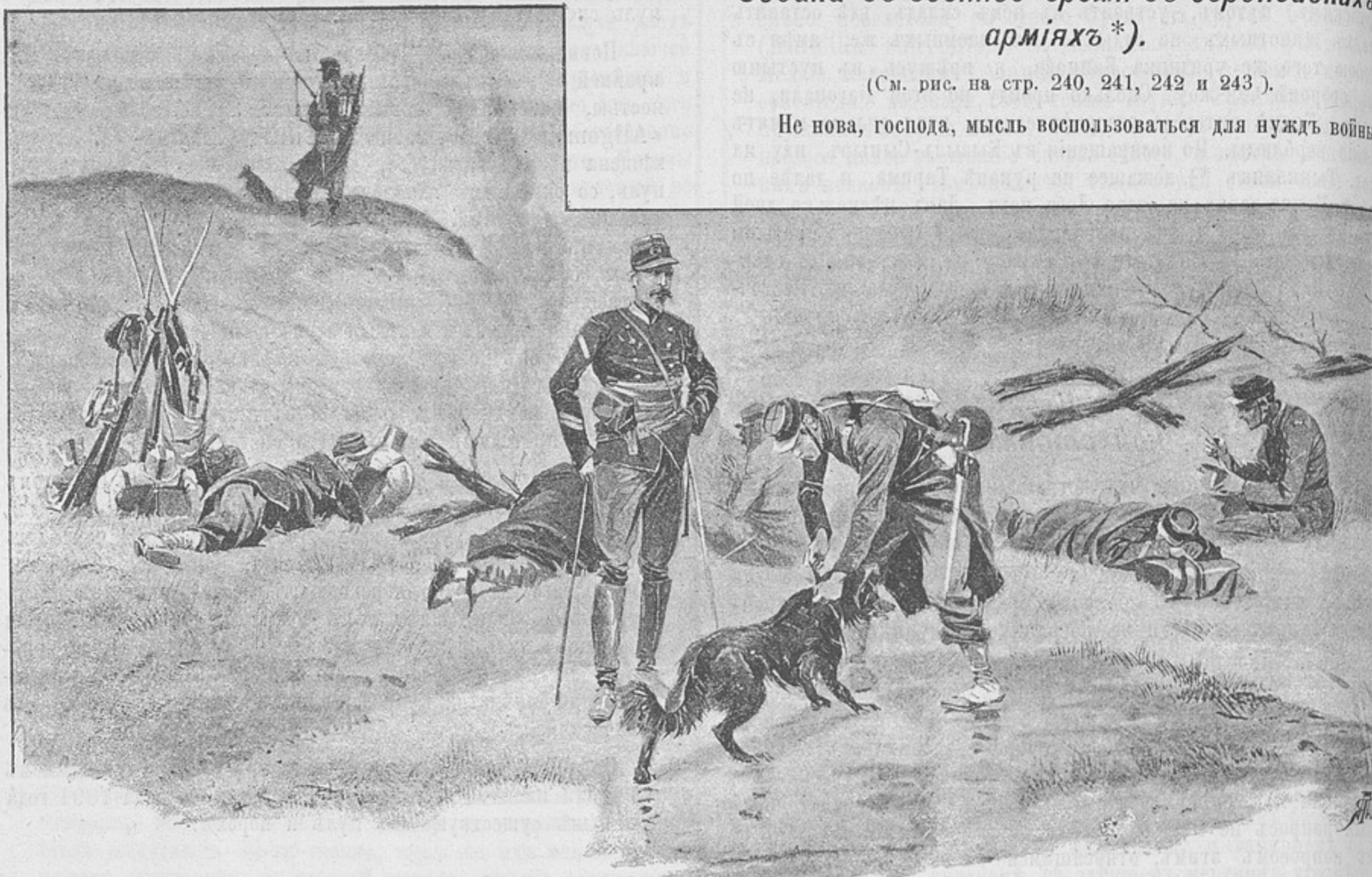
Франція: Военная собака принесла донесение.

Не нова, господа, мысль воспользоваться для нужд войны