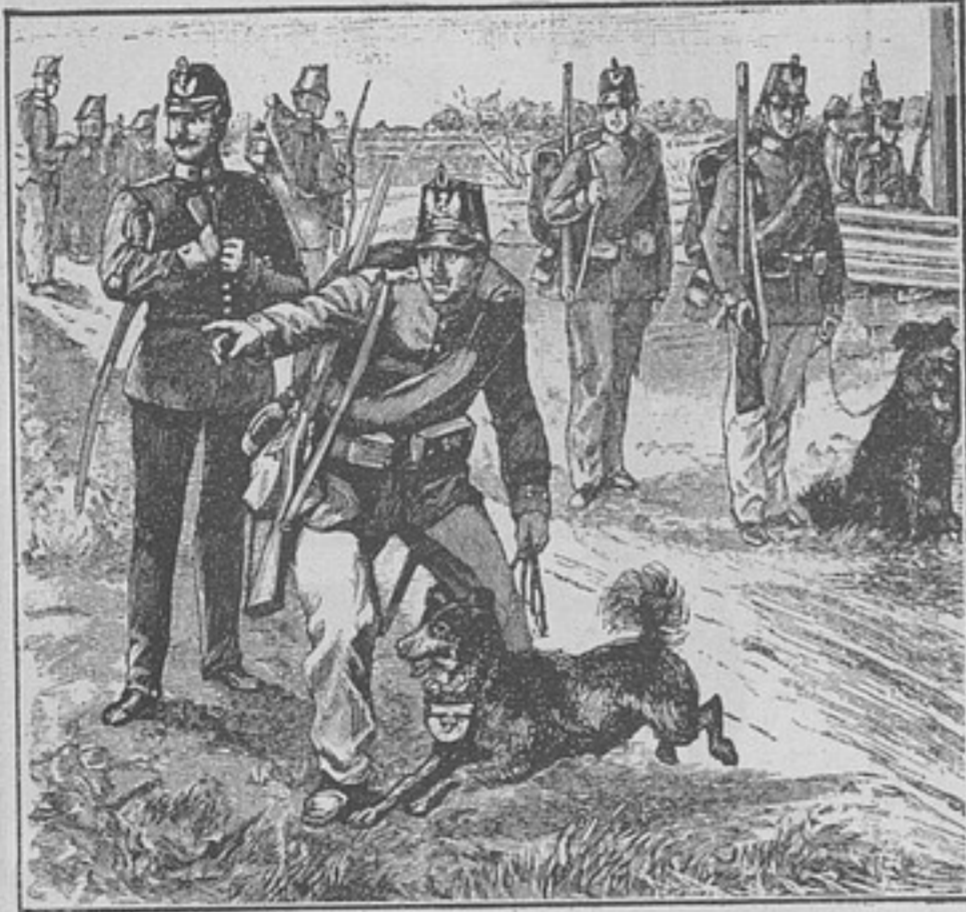
Германія: Отправка пакета.

Такимъ образомъ, и въ этомъ случаѣ, нѣмцы привыкають къ мысли имѣть противъ себя въ одинъ прекрасный день эти два соединенные народа. Мнимые французы и русскіе продѣлываютъ все возможное, бьютъ и мучатъ собакъ, чтобы раздражить ихъ до послѣдней степени. Мало того, они ругаютъ ихъ на обоихъ враждебныхъ языкахъ. Когда собака «готова» (à point), т. е. доведена до чертиковъ своими мнимыми противниками, тогда къ ней подходят нѣмецкіе солдаты — на этотъ разъ ужъ настоящіе, — ласкають и даютъ ей мяса. Послѣ нѣсколькихъ подобныхъ упражненій урокъ заученъ твердо.