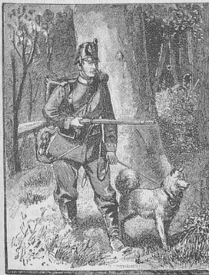
Германія: Патруль съ военной собакой.

при обученіи нѣмецкихъ собакъ, солдаты изображаютъ не- пріятели, передѣваясь въ русскіе и французскіе мундиры.