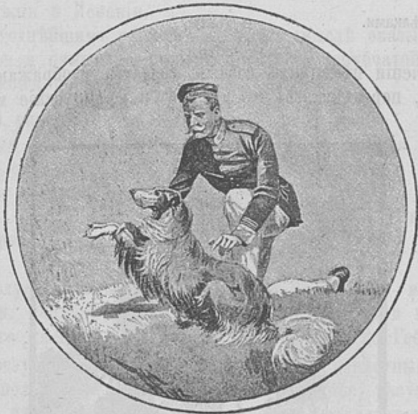
Германія: Первоначальныя упражненія военной собаки «Цыцъ».

Въ недавнее время отъ собакъ стали требовать еще и другой службы — сестеръ милосердія. Въ бою и послѣ боя