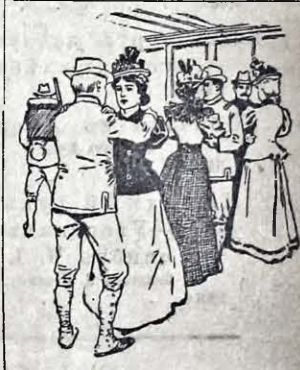
“GOODBY, SWEETHEART” ..Бувайте здорови. дѣвчата“

Испанскїи католицкїи епископы приказали молити ся по костелахъ до Бога, щобъ допомѣгъ Испанцямъ выбити Американцѣвъ, а папскїи делегатъ въ Вашингтонѣ приказавъ зновь американскимъ католикамъ молити ся, чтобы Богъ допомѣгъ выбити Испанцѣвъ. И теперь Пянь Богъ буде певно мати „тробель“, бо не буде знати котрой стороны вслухати. А ту однїи добрїи католики, и другїи не зли.