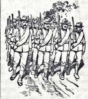
OFF FOR THE FRONT. На войну.

мерикаскими кораблями. А Самсонъ, котрый такъ довго волочивъ ся зѣ своею эскадроною за испанскою флотою, тодѣ якъ бы на злѣсть, поѣхавъ собѣ до Кїи Вестъ. И коли нашїи були въ Кїи Вестъ на якихъ тамъ нарадахъ, испанскїи адмиралъ потихоньки подѣхавъ собѣ ажъ подъ Кубу, певно при вѣзъ, что треба було для испанского войска на Кубѣ, и зновь собѣ десь выѣхавъ на отверте море. И теперь глядїи его, де хочешъ. По правдѣ Самсонъ поѣхавъ за нимъ, але то все за вѣзно. Американцѣ теперь по тронки зачинають вже гнѣватисъ на Самсона, що такъ якось давъ ся вывезти Испанцямъ