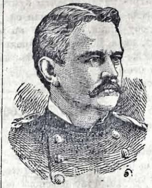
GENERAL MERRITT. Генераль Мерритъ.

Въ Вашингтонѣ уваги генерала Меррита, якъ досвѣдченого волека, бувало на войнахъ, вповнѣ увзгляднено. Сего тыждня мае Мерритъ выѣхати зъ Санъ