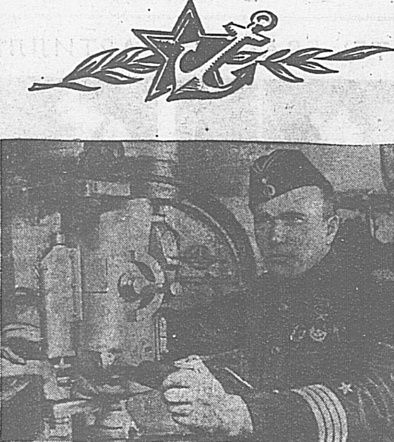
В центре — Герой Советского Союза И. А. КОЛЫШКИН, знаменитый подводник Севера, мастер грозных торпедных атак. Много немецких кораблей пустил ко дну подводники под его умелым руководством.