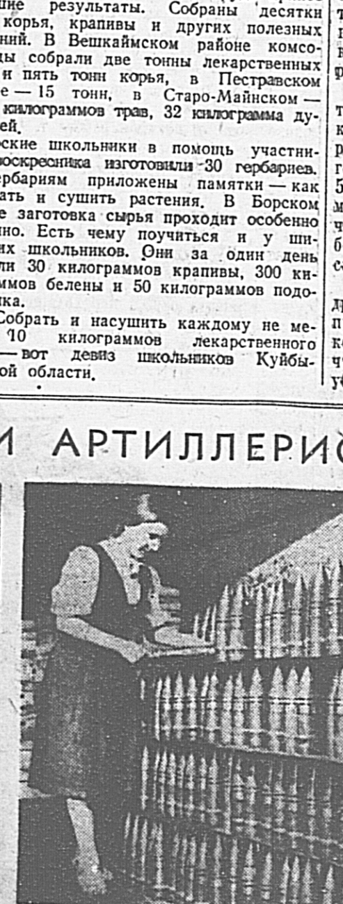
Завод № 70 занял первое место во Всесоюзном социалистическом соревновании. Фронтники вручили коллективу знамя Центрального Комитета ВКП(б).