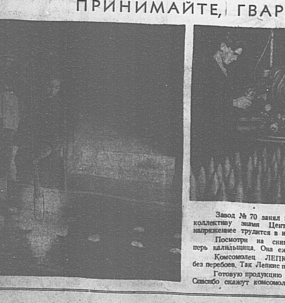
Завод № 70 занял первое место во Всесоюзном социалистическом соревновании. Фронтники вручили коллективу знамя Центрального Комитета ВКП(б).