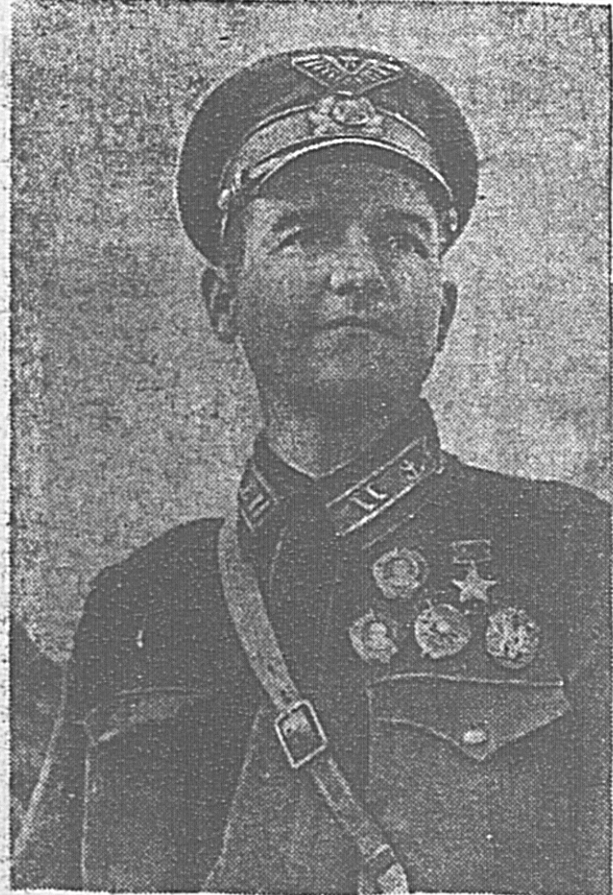
Военно-Морской флот гордится лучшими своими мастерами воинского искусства, Героями Советского Союза. На этих снимках вы видите знатных людей Военно-Морского флота. Слева — Герой Советского Союза Н. В. ЧЕЛНОКОВ, Гвардейская часть, в которой он служит, воспитала шесть Героев Советского Союза и 170 орденосцев. Славные летчики потопили 28 немецких кораблей, уничтожили около 100 немецких самолетов, 60 танков и 9 эшелонов.

Всесоюзный комитет по делам физкультуры и спорта решил переименовать «Кросс Знамя ЦК ВЛКСМ» в «Кросс Знамя ЦК ВЛКСМ».