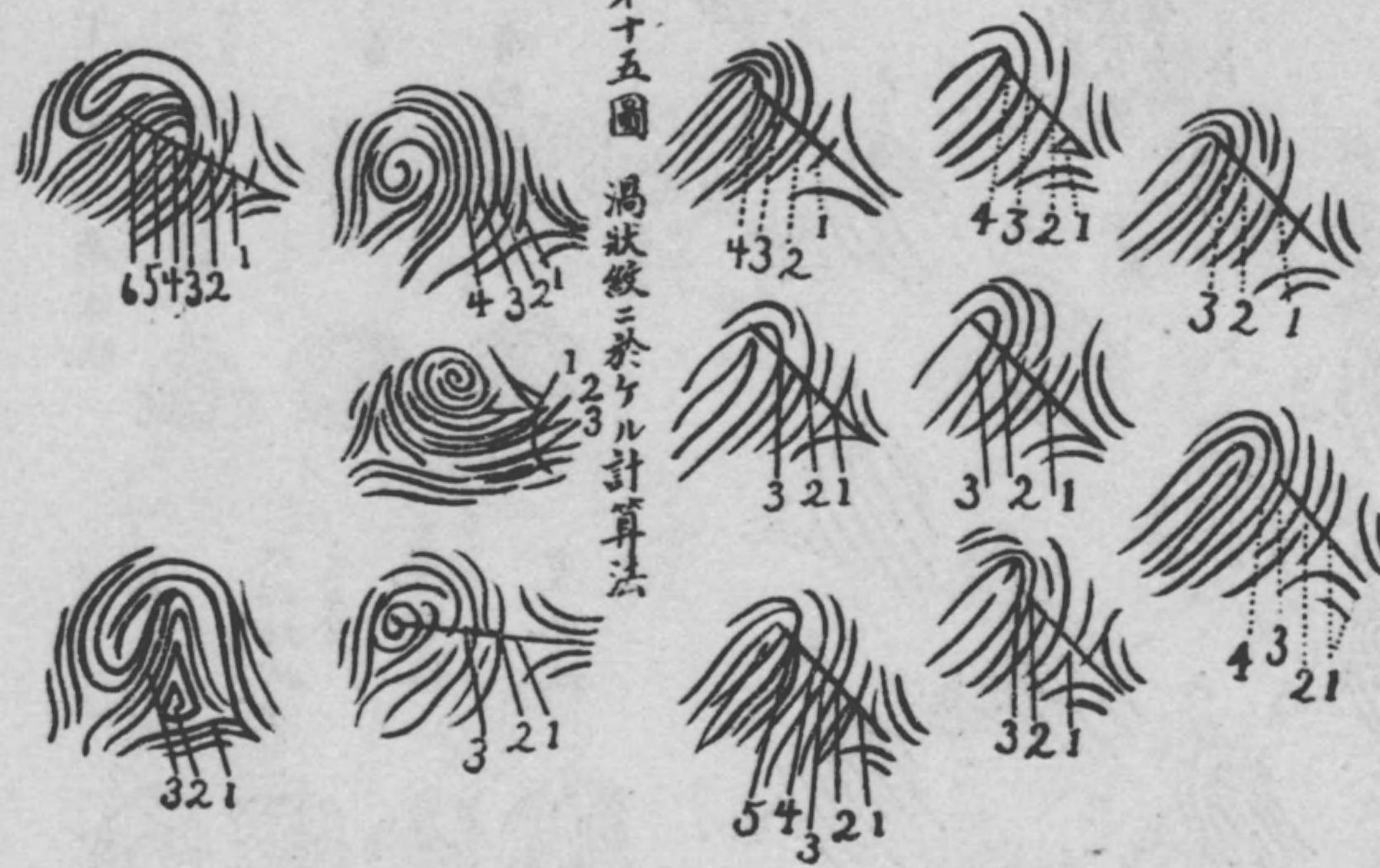
第十五圖 渦狀紋ニ於ケル計算法