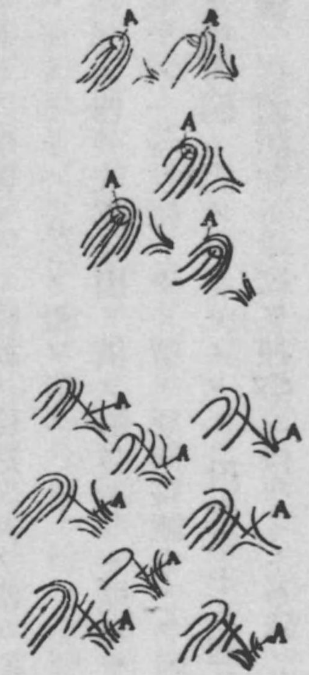
第五圖 外端(Aヲ以テス)