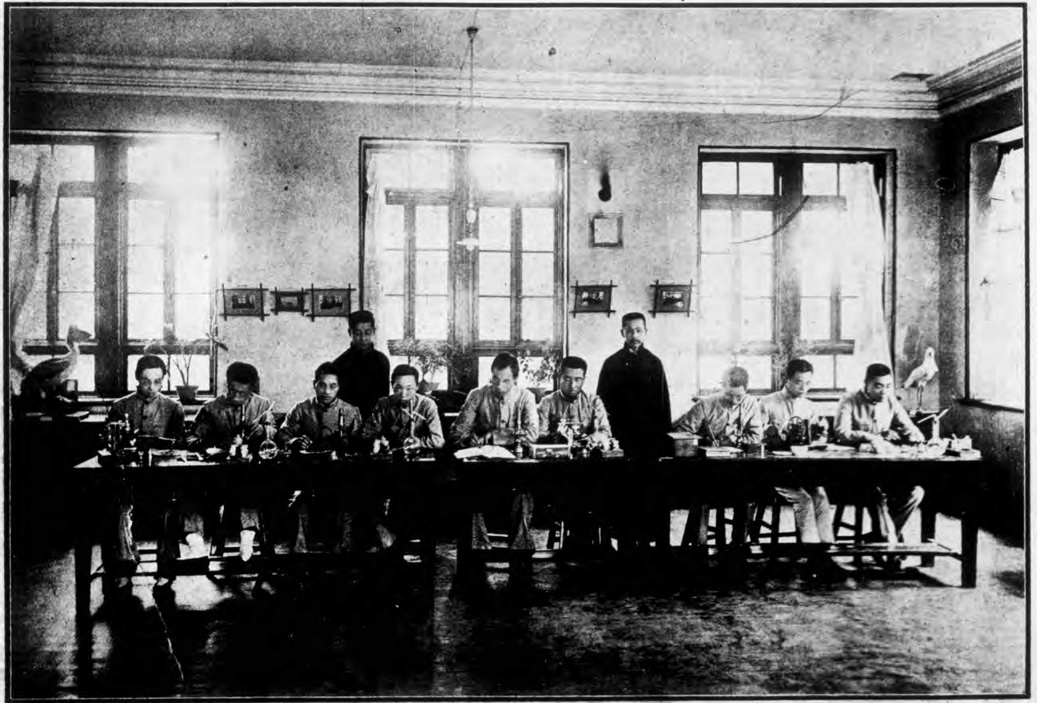
北 京 高 等 師 範 學 校 博 物 部 三 年 級 動 物 實 驗 狀 况 攝 影