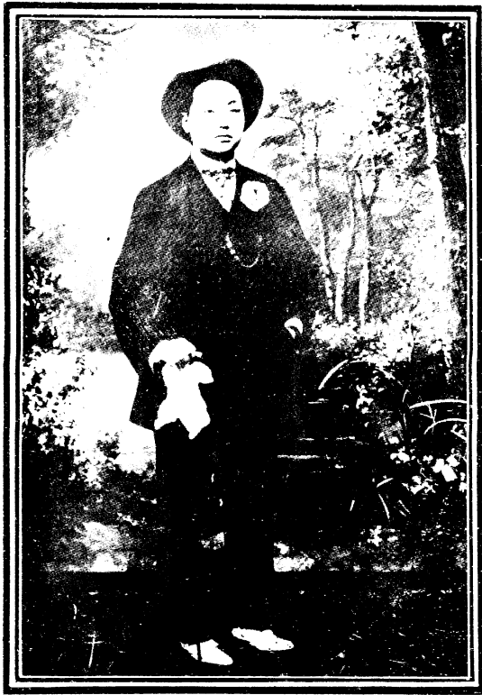
琴 克 王