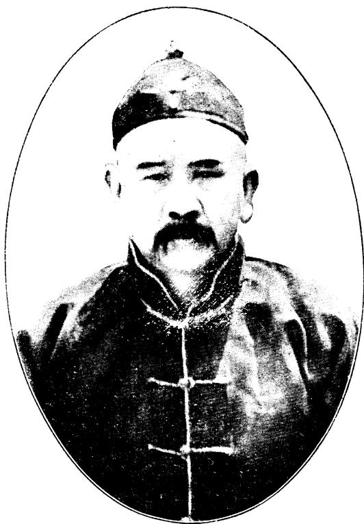
最 近 之 張 勳