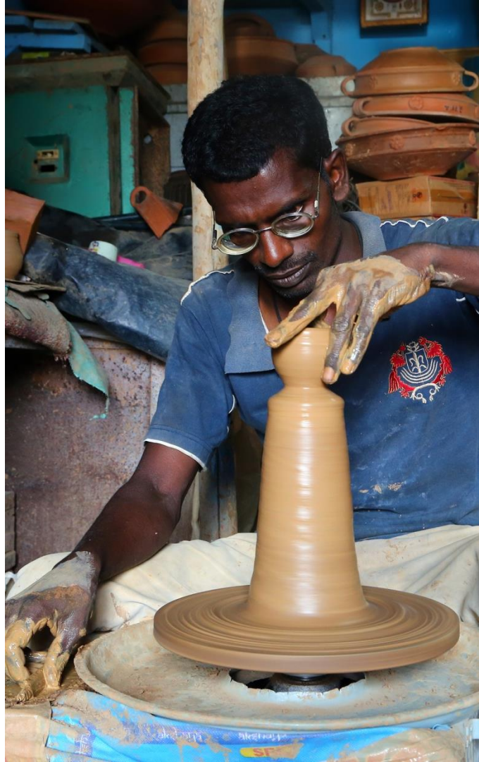
Muhammad Mahdi Karim, GFDL 1.2