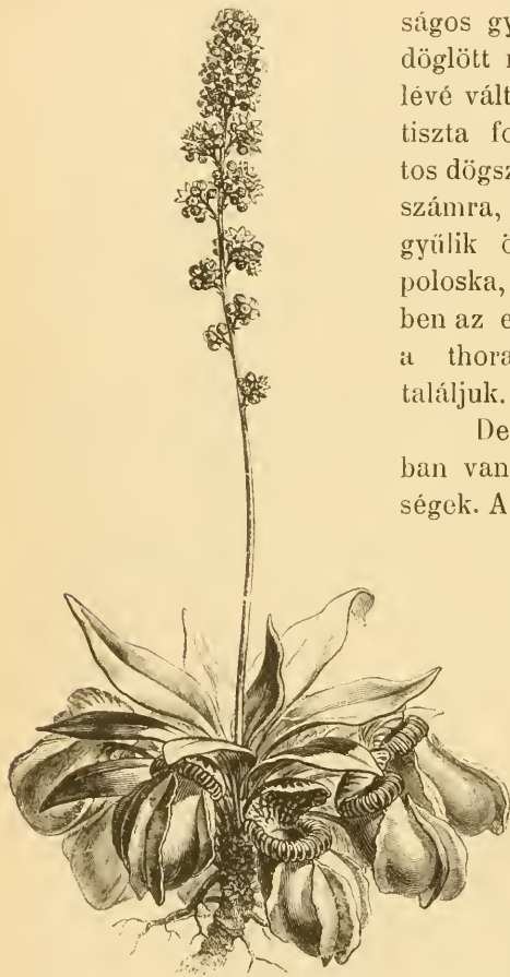
Cephalotus follicularis Labill. Kisebbitve. visszatérni.

Sarracenia kancsóit belül, lefelé álló tüskék borítják. A százlábú vizen kívül eső része élénk mozgással igyekezett továbbállni, de az emésztő folyadékba merült része nem engedte. Ez néhány óra lefolyása alatt nemesak mozdulatlaná vált, de lényegesen meg is változott és megfehéredett. Ime, az oly ártatlannak látszó növényke voltaképen a legkegyetlenebb gyilkos, mert áldozatát már élve is megemésztí!