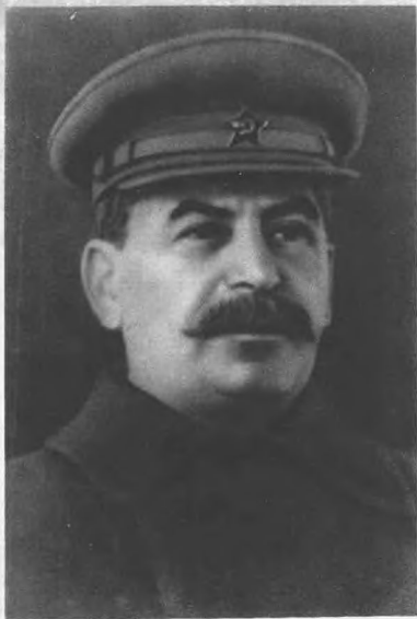
蘇聯全國軍隊最高總司令、維、斯大林