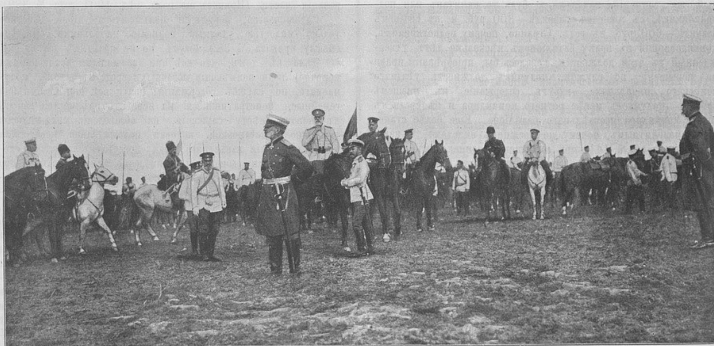
Большіе маневры 1903 года. На одной изъ позицій сѣверной арміи 8 августа.

Какъ это ни странно, но если намъ, офицерамъ, дать въ руки карандашъ и бумагу и посадить насъ на классную скамейку, мы сейчасъ же превращаемся въ школьниковъ со всѣми типичными достоинствами и недостатками послѣднихъ; ни гусарскіе усы, ни сѣдина, ни плѣшь на макушкѣ не спасаютъ насъ отъ свойственной, казалось бы, одному дѣтскому