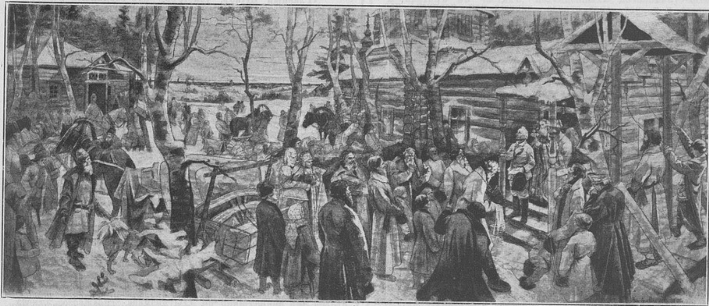
Мозаичная картина «Отъѣздъ Суворова изъ села Кончанскаго», надъ фронтомъ Суворовскаго Музея.

Всякая наука основана на прогрессѣ. Можно рѣшить и тысячу подготовительныхъ задачъ-этюдовъ, но нужно же когда-нибудь приступить и къ дѣлу. Человѣку, изучающему, допустимъ, скульптуру приходится, быть можетъ, испортить на подготовительныхъ работахъ и не мало матеріала, но представьте себѣ положеніе такого мученика искусства, которому