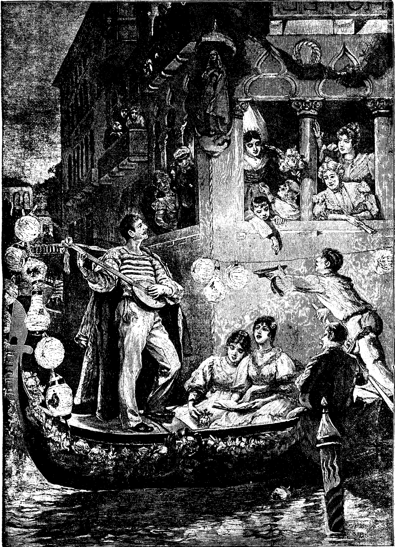
INAUGURAREA GONDOLEI ÎN VENETIA.