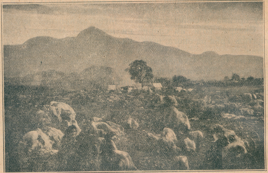
Логор црногорског престолонаследника на Ријоли под Скадром

Тек сад је било занимљиво посматрати бегство непријатеља низа страну Бардањолта. Шрапнели наших топова, који су веома вешто крчили пут јуришу, такође су вешто стопу у стопу непријатеља гонили. Низ Бардањолт бежао је непријатељ у страху, метежу, нареду. Могле се видети на дурбин читаве масе, па коњи, мазге, карови, кароце, и све се то у паници повлачило према мосту на Киру, где падну наши шрапнели и од масе направе клупче, које се котрља у кори-