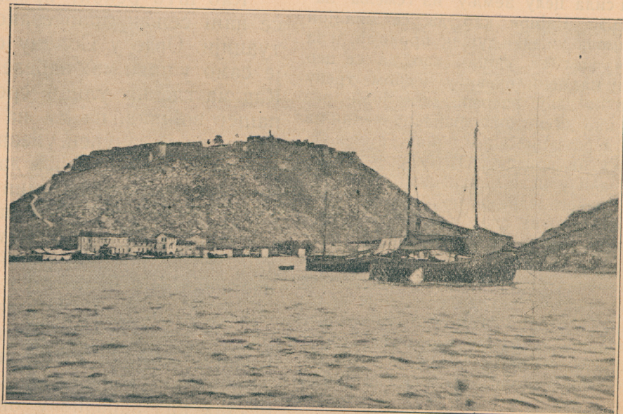
Скадарска тврђава поглед са језера

...О, Боже Створитељу, велика дела твоја јесу, Господе! Али ово што сам гледао тада, нису дела Твоја, него дела грешних људи... Мени се чинило, као да из топова огњених на све стране плину један страховит пламени океан, па поче плавити целу ону црну небесну пучину; из њих сташе шибати горостасни пламенови, а цео простор око Једрена страховито се узбурка и потресе. Мени се чинило, да су и оне неколике звијезде небесне неописаном брзином полетеле овоме пламеном океану, да се у њ утопе. И ова страшна канонада, чинило ми се, да је потресла цео простор до Цариграда па и Цариград. А за Мустафа Пашу да и не говорим. Тамо су се тресле куће, као да је највећи земљотрес. Сутрадан ни у једној кући није било прозора, који није био прснуо. Све се је око нас претворило у један ватрени океан, чије крајеве нису могле догледати очи наше. То беше један неизмеран хаос, састављен из огња и оних помамних распрскавајућих стихија, што једна другу не трпе, што једна другу потискују, прогоне — што једна другу прождиру!.. Површина овог ватреног хаоса не да се описати. То управо и није била површина већ некаква ватрена помама. Она се није само таласала, већ су њени вали за-