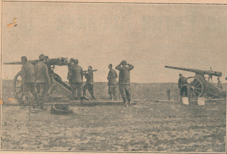
Црногорци бомбардују Дечић и Шипчаник

тризовани, и слутили смо, да ће се кроз који час можда одиграти један велики чин, који обично после историја записује на својим странама.