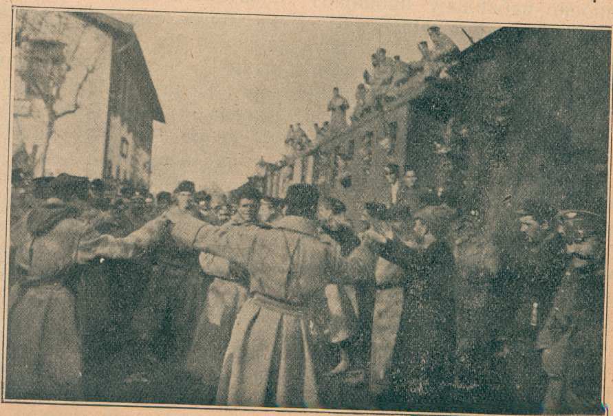
Састанак српске и бугарске војске под Једреном

Кад малочас споменух оног хармуникаша, паде ми на ум опет једна ситница, која лепо показује с колико много хумора полази наш официр на Скадар. Дакле тај војник — армуникаш и није никакав војник; то је један сасвим обичан армуникаш у цивилу, који је наше артиљерце толико пријат-