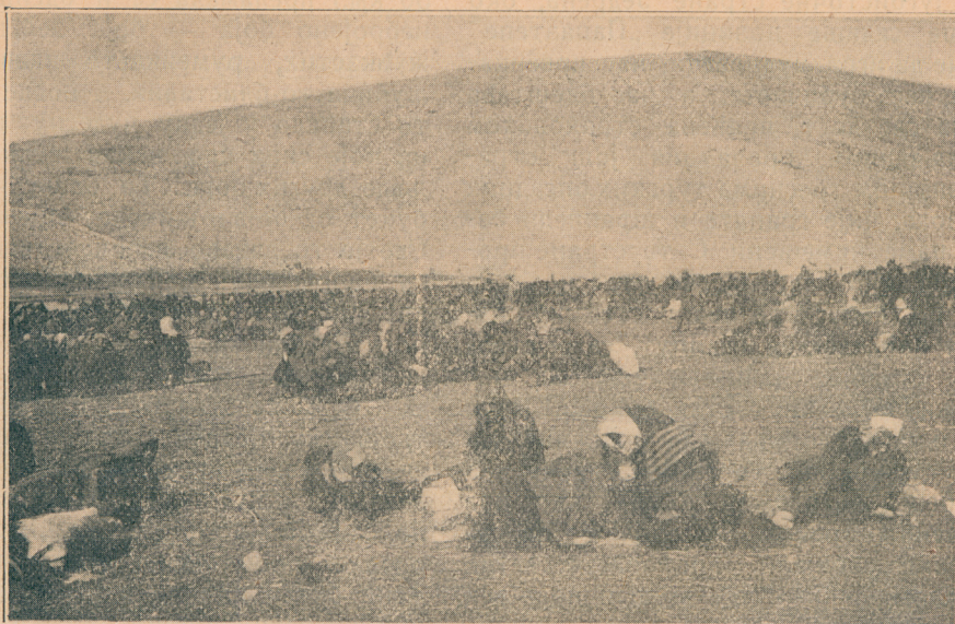
Заробљени Турци на Ђемовском пољу код Подгорице

пљускивали сам небесни зенит; она је јаукала, фијукала, врила, пенушила, кипела; а њени пламени кључеви достизали су до самога свода небесног. Најпре се разјапе страховита огњена ждрела, па онда из њих, муњевитом брзином, бљуну пламени букови, који својим распрскавајућим материјама покрију цео простор око нас и над нама. ...Шта Давалагири, шта Кордиљери, — то су према циновским валима овога помамљеног топовског пламеног океана — мајушне борице, што их вечерњи зефир набира на огледалцу каквог тихог језерца. Па онда, она писка, оно фијукање из грла 700 топова, она демонска помама хоће из темеља да покрене и земљу и васељену; па оно језовито проламање артиљерије као да је испуњавало читаву васељену.