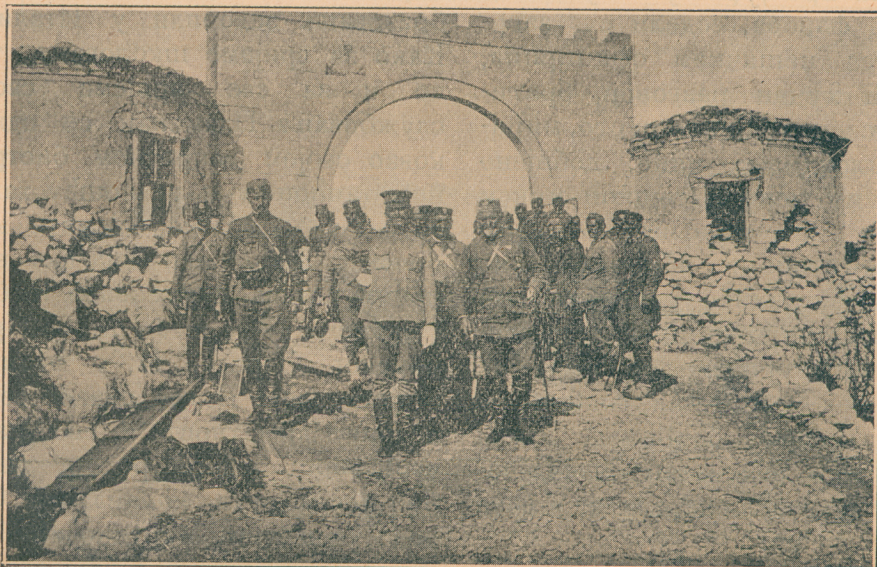
Црногорски престолонаследник Данило у освојеној тврђави Шипчанику

Та паклена ватра, та топовска грмљавина од које су се тресли и небо и земља, — имали су мађијско дејство на наше војнике и на нас офицере. Изгледали смо сви као наелек-