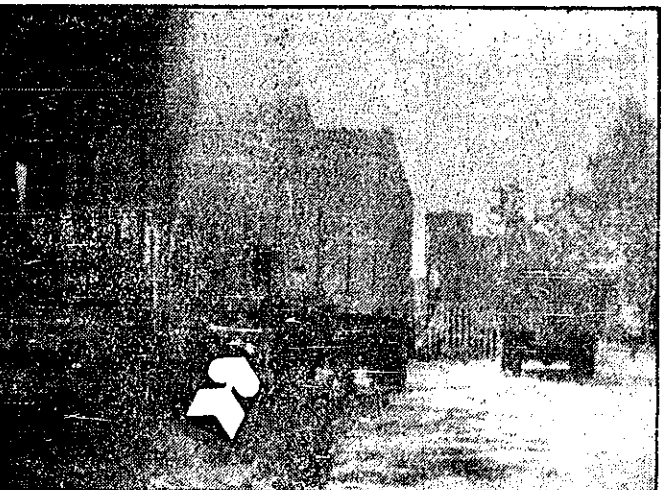
کامیونی که از گمرک شیراز با محموله اسلحه خارج شده بود، خالی، توسط مأموران انتظامی پیدا شد و در محوطه گمرک تهران از آن نگهداری میشود

میشود. این کامیون خالی بوده و هنوز روشن نیست محموله اسلحه آن را کجا تخلیه کرده اند. علاوه بر این اسلحه میان جیبهای آن که گفته میشود اسلحه میان جیبهای آن که این شرکت به ایران حمل کرده جامازی شده بود (تیز در بیانهای اطراف جاده کرج پیدا شد). این جنیده را آنتوان لابر بعد از تخلیه اسلحه و مواد منفجره و تفنگ، برت کرده و رفته است. از سوی دیگر خبرنگار خوارزمی که بیان از راه پلیس بینالمللی در ایران تلبیس گرفته است و مأموران پلیس بینالمللی به خبرنگار با گفتند ما هیچ مشخصاتی از آنتوان لابر از این شرکت نداریم. با این حال امید می رود پلیس بینالمللی بتواند با کوشش بیشتری سوابق این مرد را از پلیس آریامهر بدست بیاورد و کوشش برای دستگیری وی را آغاز کند. پلیس آریامهر نیز است که آنتوان لابر از ایران خارج شده است و اینک هنوز در ایران است. جستجو برای پیدا کردن آنتوان لابر از آنتوان لابر ادامه دارد. پلیس است که تلاش میکند پلیس آریامهر را توسط مأموران انتظامی پیدا شده است و هم اکنون در محوطه گمرک نگهداری