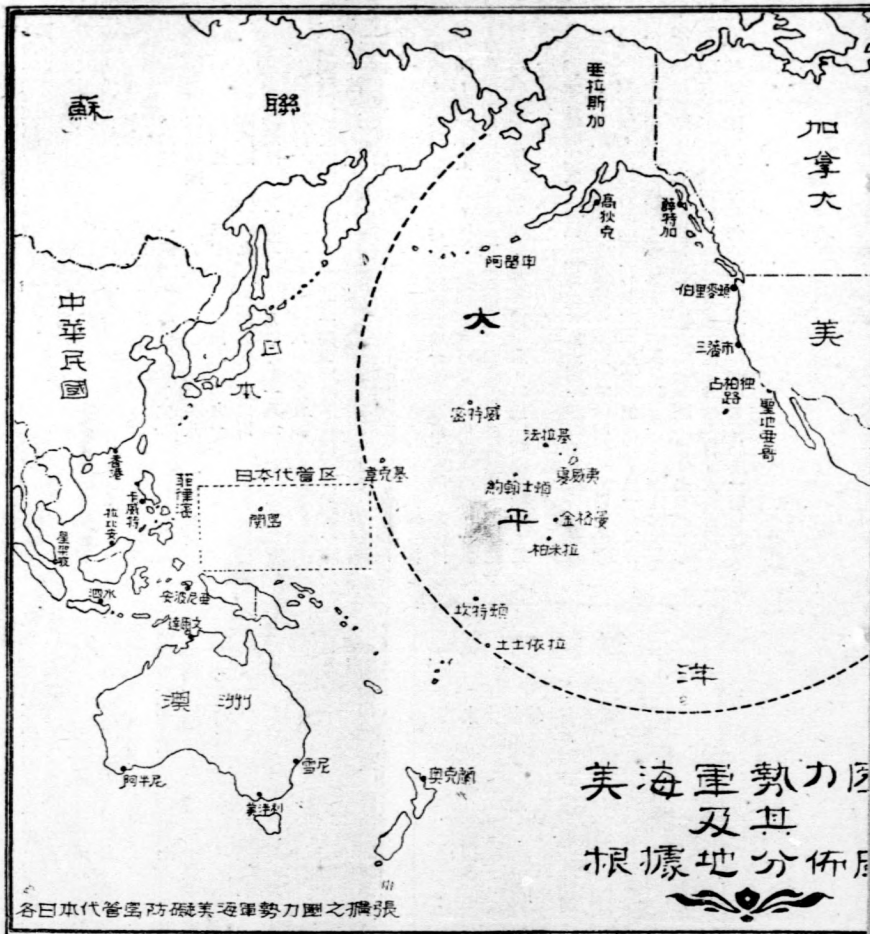
美海軍勢力及其根據地分佈圖