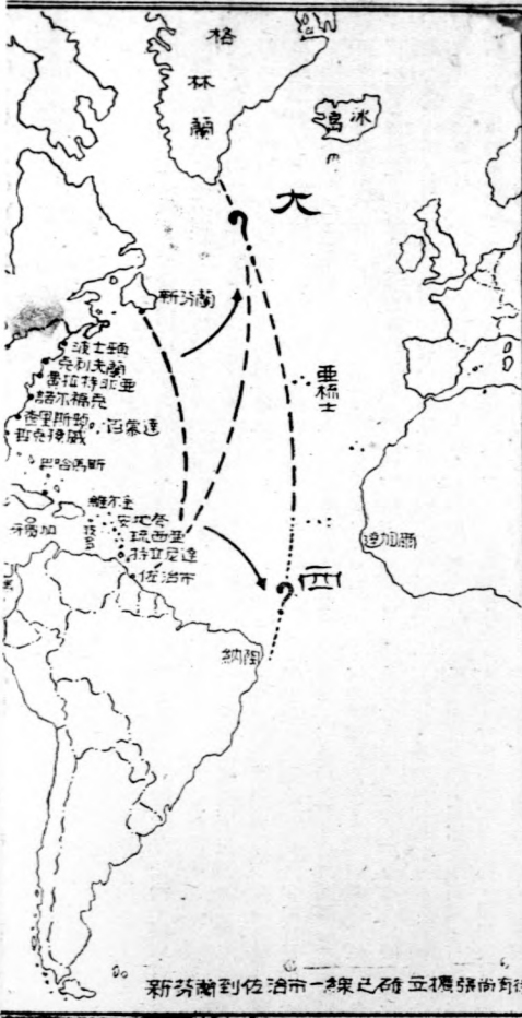
新芬蘭到佐治市一線之奇立機路與海待

不能沒有根據地而行動，此外根據地 在東西兩洋的沿岸都有設備完善的良 取得內線作戰的便利的巴拿馬運河，雖然開 衛森嚴的根據地。兩洋之中，美國也具有不少 本港是全世界數一數二的，但是其中因為有些並 有些坐落不甚適宜的位置，反之在軍事要衝却找 建設，這些都是美國海軍和它的防衛上的遺憾地方 關島的不設防使到日本的代管島嶼能夠聯成一氣， 濟的通路，菲律賓的卡威特港和阿留申的荷蘭港也未有 使美國難以防衛菲島，並且將兩地作為進攻日本的據點 上，美國在軍事的重要地位也沒有根據地，以完成進一步的 軍的行動。 美國人已經念起直追了。他們的辦法就是：第一，將所有的良港