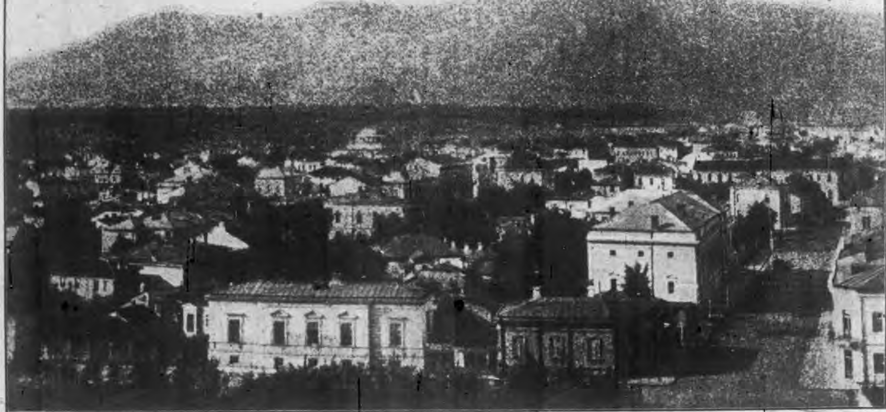
布加利亞蘇非京全圖拓影