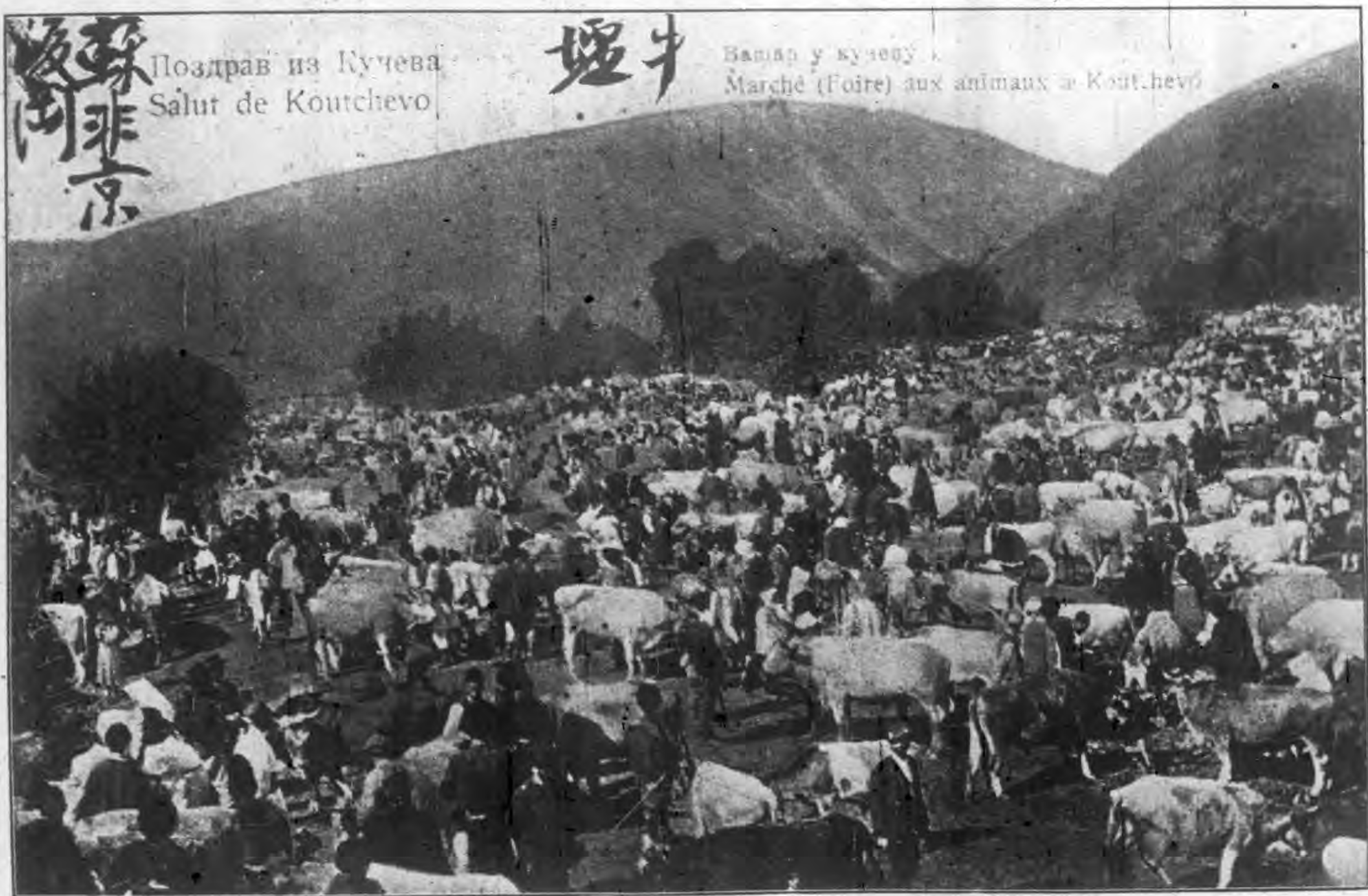
影 拓 墟 牛 岡 後 京 非 蘇

Вашар у кучеву Marché (Foire) aux animaux à Koutchevo