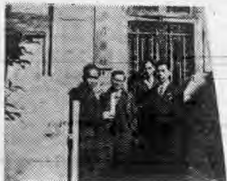
蘇北行 營黨副 官來訪 本社時 留影紀 念攝

日本爲應付以上之情勢，而期國運之發展計，乃促進國內之全力團結，確保必勝之體制，乃當務之急，各種施策亦應集中於此，政府確定國政各部對戰爭上必要之方策，以便迅速實現，即維持及增強戰時生產力起見，對企業上優秀者集中資材、勞力、電力及資金，且充分活用既存之設備，更對國防上重要產業之生產個別加以考慮，整理戰時食糧之對策以固國民之生活，而今日最嚴重之問題，並非資源不足，乃改善交通，強化運輸之問題，又爲實現國策計，國民資金之儲蓄亦屬絕對必要，因此政府爲國民儲蓄之增多計更爲努力，開戰以來，日本國民之活動範圍更形擴大，而國民之責任亦愈重大，國民本質之增進及人口之增加爲實現戰爭對將來完成建設上乃屬絕對必要者，故竭力刷新教育，根本整理醫療制度，以謀國民之健康，政府根據以上理由，提出預算案及法律案，且切望迅速協贊。最後向各盟邦對日本之好意深表謝意，並對國民各就本位之愛國熱忱深表敬意。