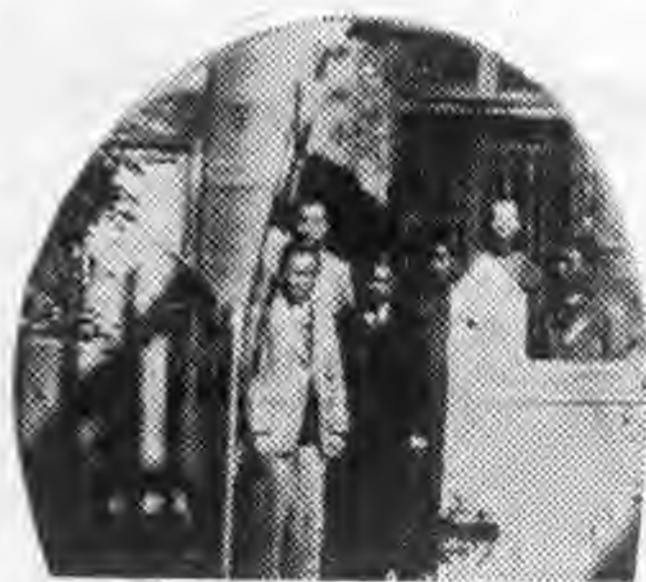
本社 職員 新年 留影 紀念 攝