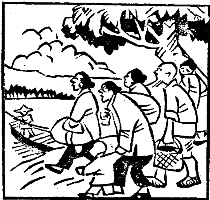
翁源民衆疏散得乾乾淨淨。

我們種種的優點，二十九年的開始，就帶給我們以粵北勝利的好消息。這次的勝利，軍事的良好配備，當然也是一個重要的原因，但是民衆方面更能發揮出偉大的力量。現在不說我們軍隊打仗的狀況，專就民衆動員的情形來報告。 如在翁源、新江、新豐、梅坑、琶江口這幾個重要地方的民衆，平時是受過組織和訓練的。第××集團軍余總司令曾經招考一千名青年，充作下層政治工作的幹部，這一千名都是廣東最優秀的份子，他們現在擔任發動民衆和組織民衆的工作。有名的翁源民衆空舍清野的大