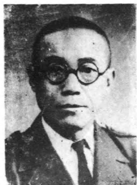
參 重 亮 事