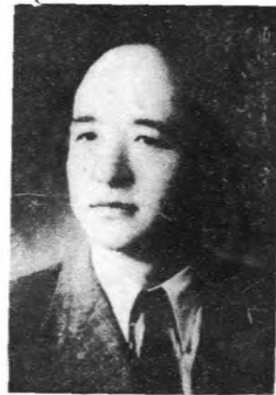
長 廳 育 教 芝 寶 趙