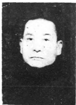
代 警 務 處 長 朱 鵬