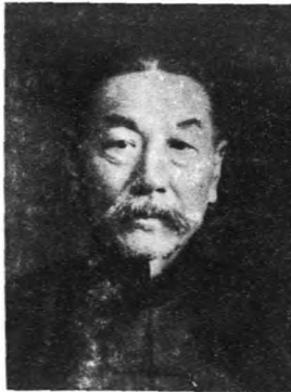
長 廳 務 政 琳 孝 張