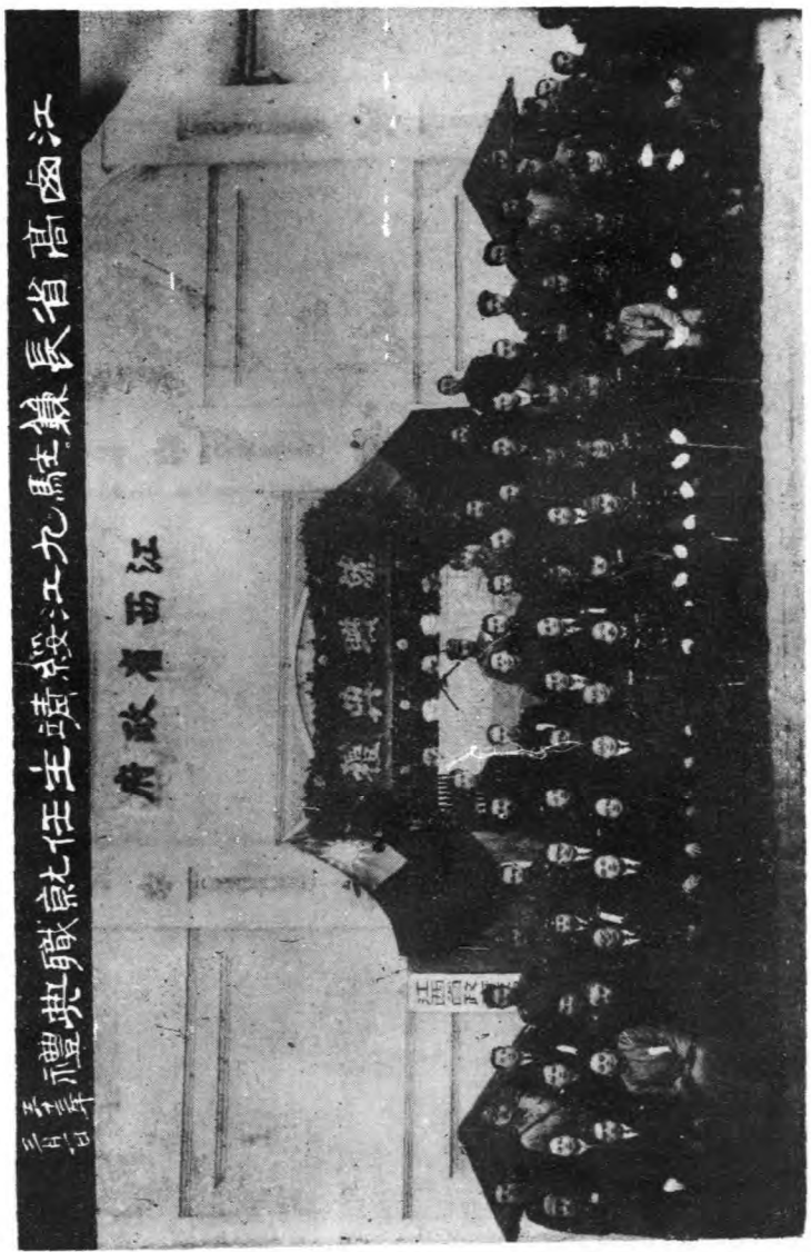
高省長兼駐江九綏靖主就職攝影