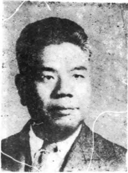
長 廳 設 建 虹 貫 周