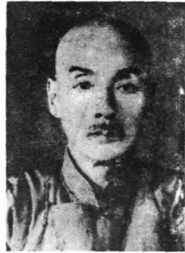
長 廳 政 財 澄 思 陶