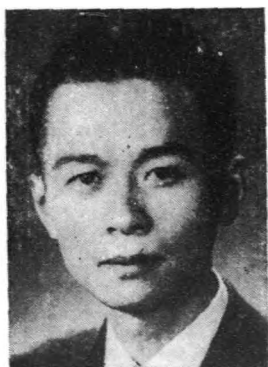
參 鄂 克 定