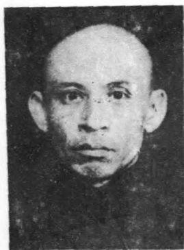
參 譚 希 呂