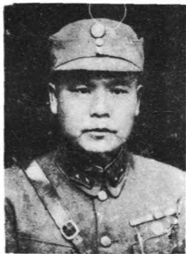
長 處 安 保 誠 敷 蕭