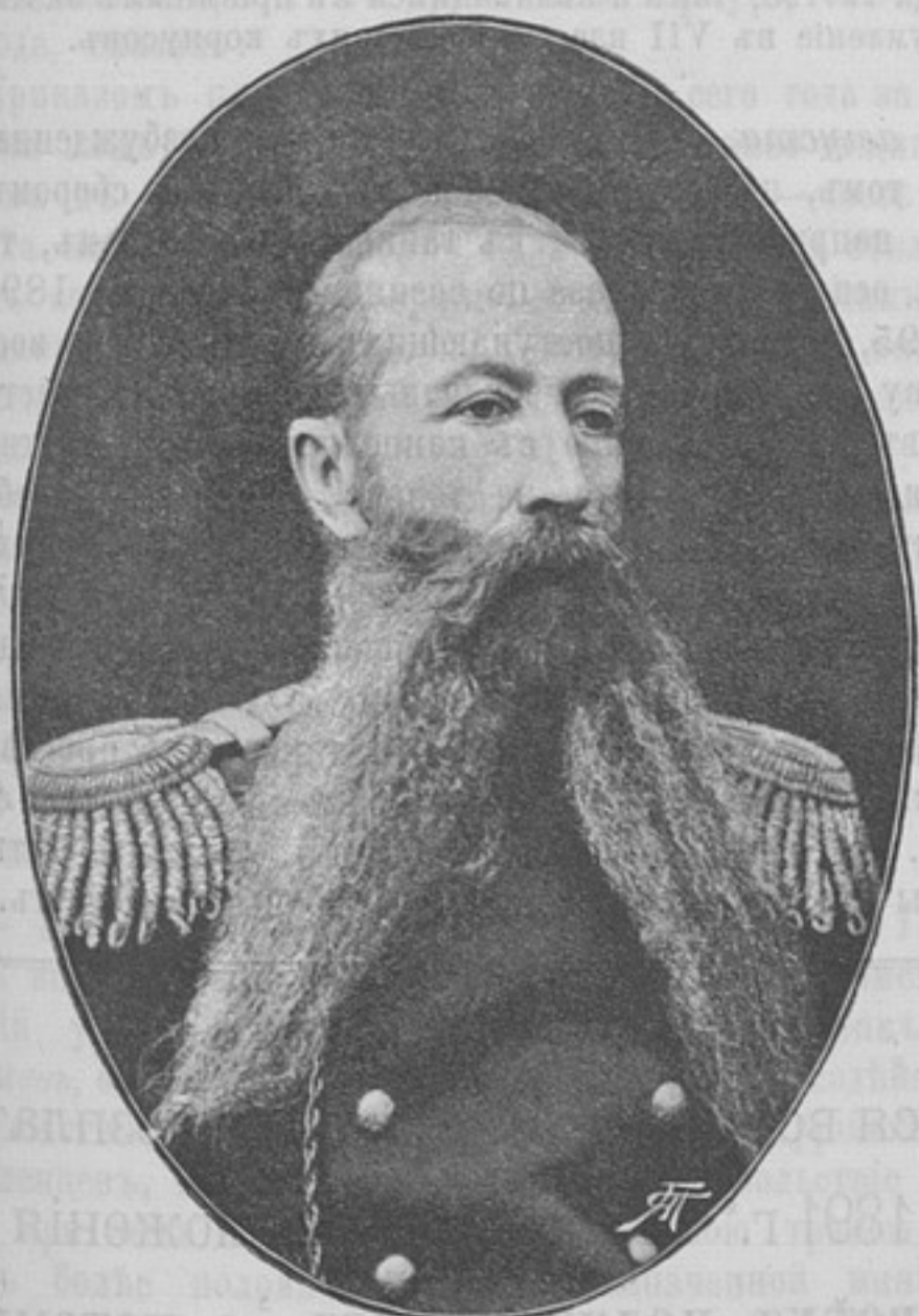
Начальникъ 20-й пѣхотной дивизіи, генераль-лейтенантъ

Деньги могутъ быть высланы почтовыми марками, каждая не дороже 50 к. Безденежная подписка не принимается. За перемѣну адреса 28 к. Отдѣльные №№ высылаются за 15 к. Объявленія принимаются по особой расцѣнкѣ, высылаемой по требованію.