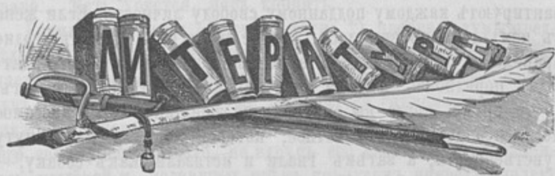
На окраинѣ *).