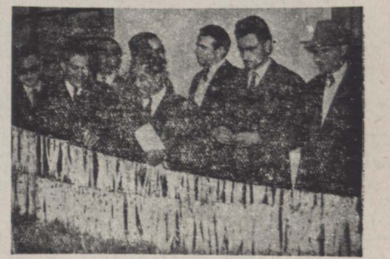
خبر نگاران در آزمایشگاه پرورش سن عملیات مبارزه با این آفت را تماشا می کنند