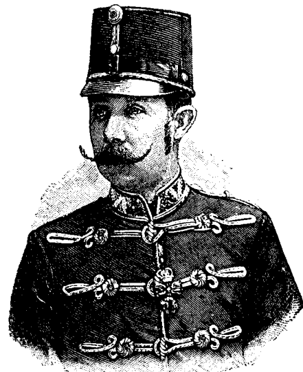
MOȘTENITORUL FRANCISC FERDINAND.