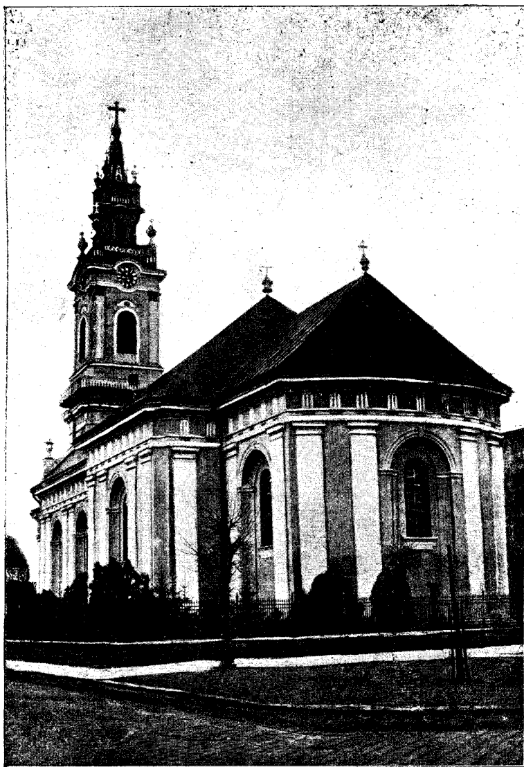
Catedrala gr. c. română din Oradea-mare.

Teatrul este cea mai bună oglindă a vieții care ne înfățosează fidel pe om cu toate virtuțile și slăbiciunile caracterului seú.