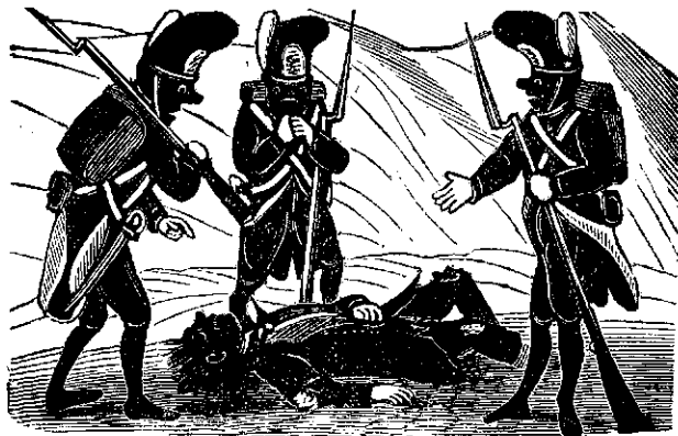
5. Dintre inimici au ramasu multi pe campulu bataliei.