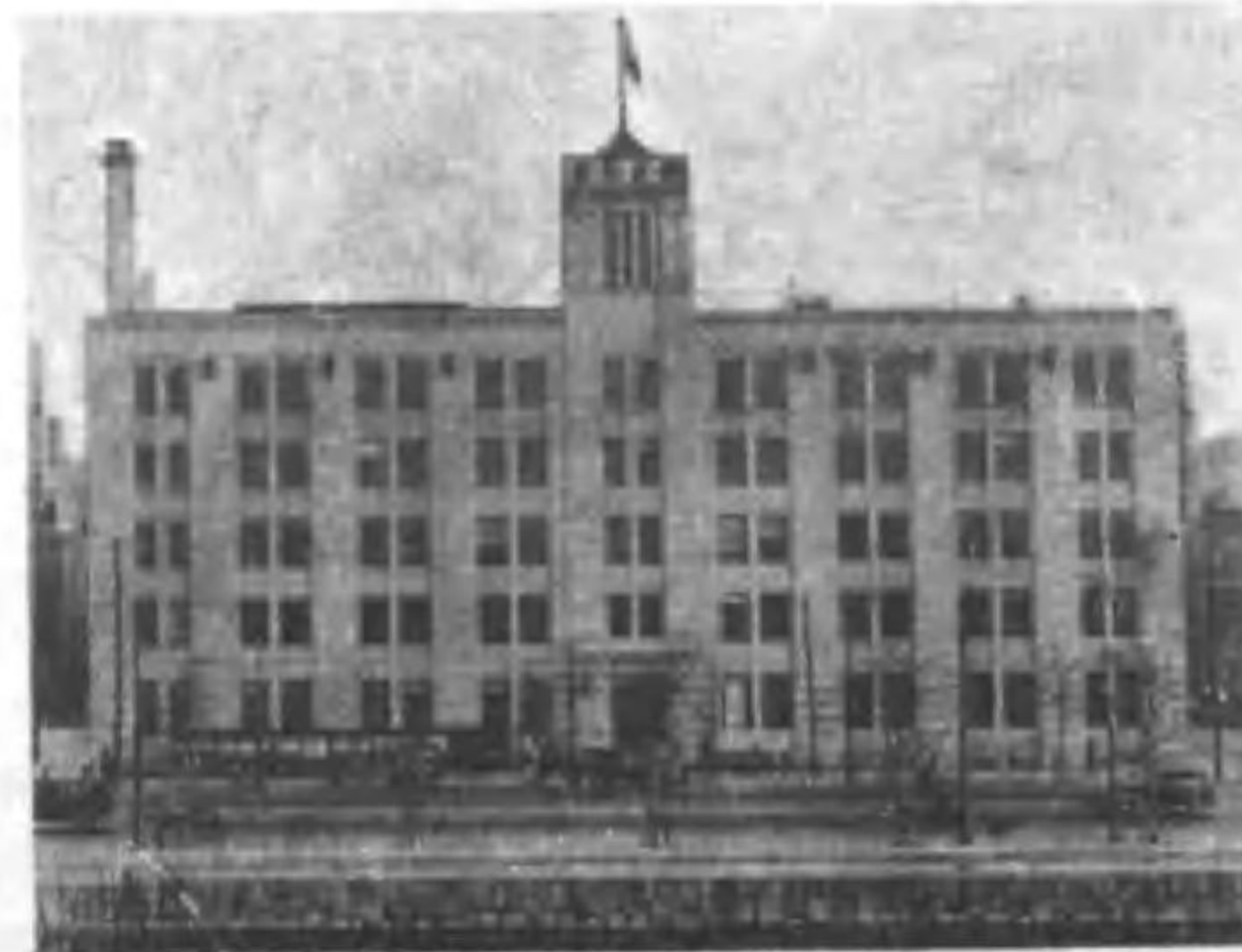
本社東京丸の内お蔵時事新報社

工業立國に方途を求むる重要性の愈々増大する秋、國民的常識として我國工業の歩みに對し正確なる認識を深めよ！