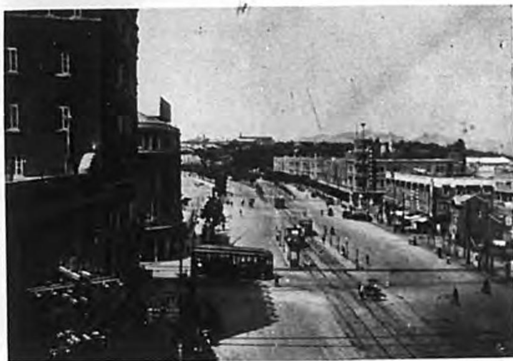
Dairen is a busy sea port. The pictures depict the famous wharf, said to be the largest in the Far East, and the Tokiwabashi-dori, "one" of the many lively streets of the city.