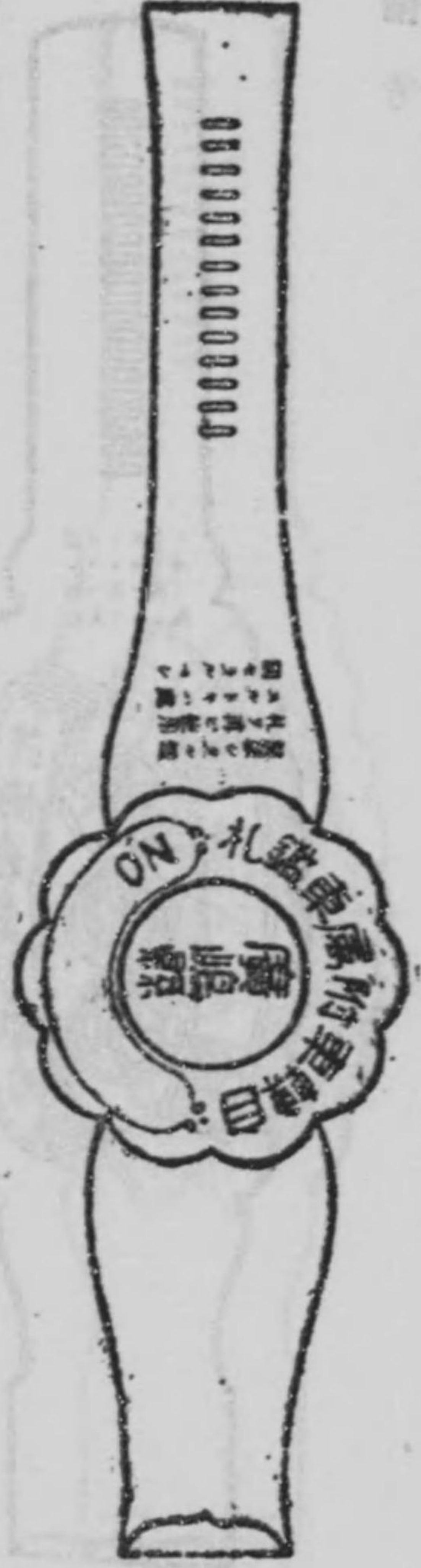
自轉車附屬車ニ附着スル鑑札