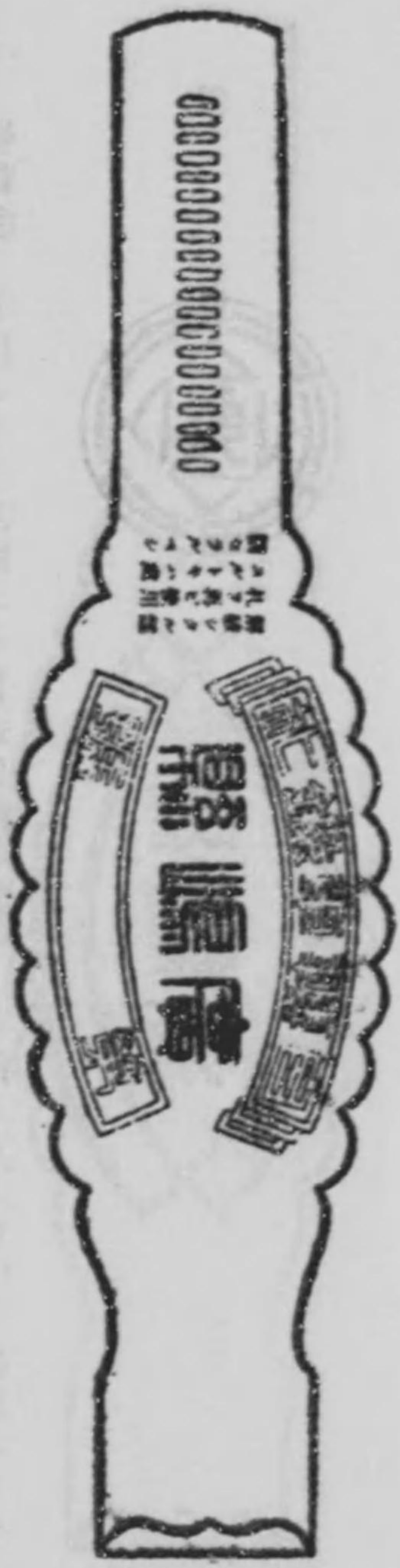
自轉車ニ附着スル鑑札