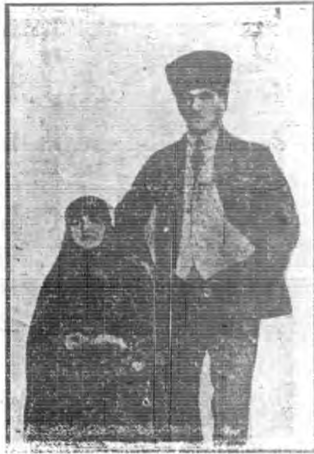
Mustafa Kemal Pasha and his divorced wife.

據八月十三日斯坦堡(君士日丁堡)傳來電息。稱八月五日土耳其政府正式發表土耳其大統領凱馬兒帕夏與其夫人拉知惠哈納母離婚公文。至其離婚理由。有謂因夫人性情過於自主。完全脫棄今日之古風。常與會受英美教育。即所謂新婦人。連交際往還。且執土耳其婦人解放運動之牛耳。在正