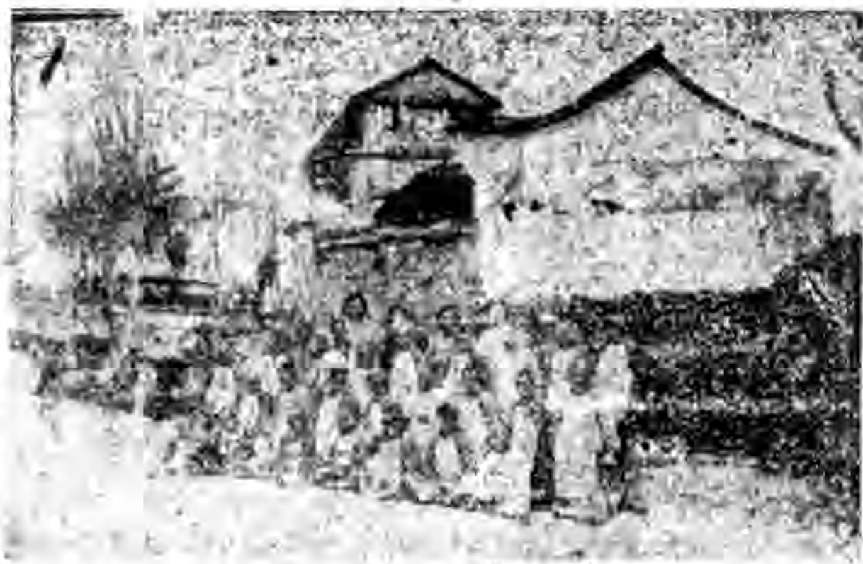
一個黑黑的，沒有人聲的深夜，就是我們動身到義島的一夜，一個個發過寒熱的小朋友走不動了，沒有辦法，只好由我們自己輪流來背。上火車的時候，幸得有許多進行的人，很迅速地把小朋友個個抱上車，巧得很，車廂又很空，我們就叫每個小朋友睡下去，不料不爭氣的肚子，老是瀉着，一個個的不斷地瀉着。

客氣的區長買了許多糖果，來慰勞我們小朋友，小朋友都很有禮貌的接受了，嘴裏還一聲親熱的「謝謝」。而做捷的隊長都跑到台上去講了有力的「謝詞」。