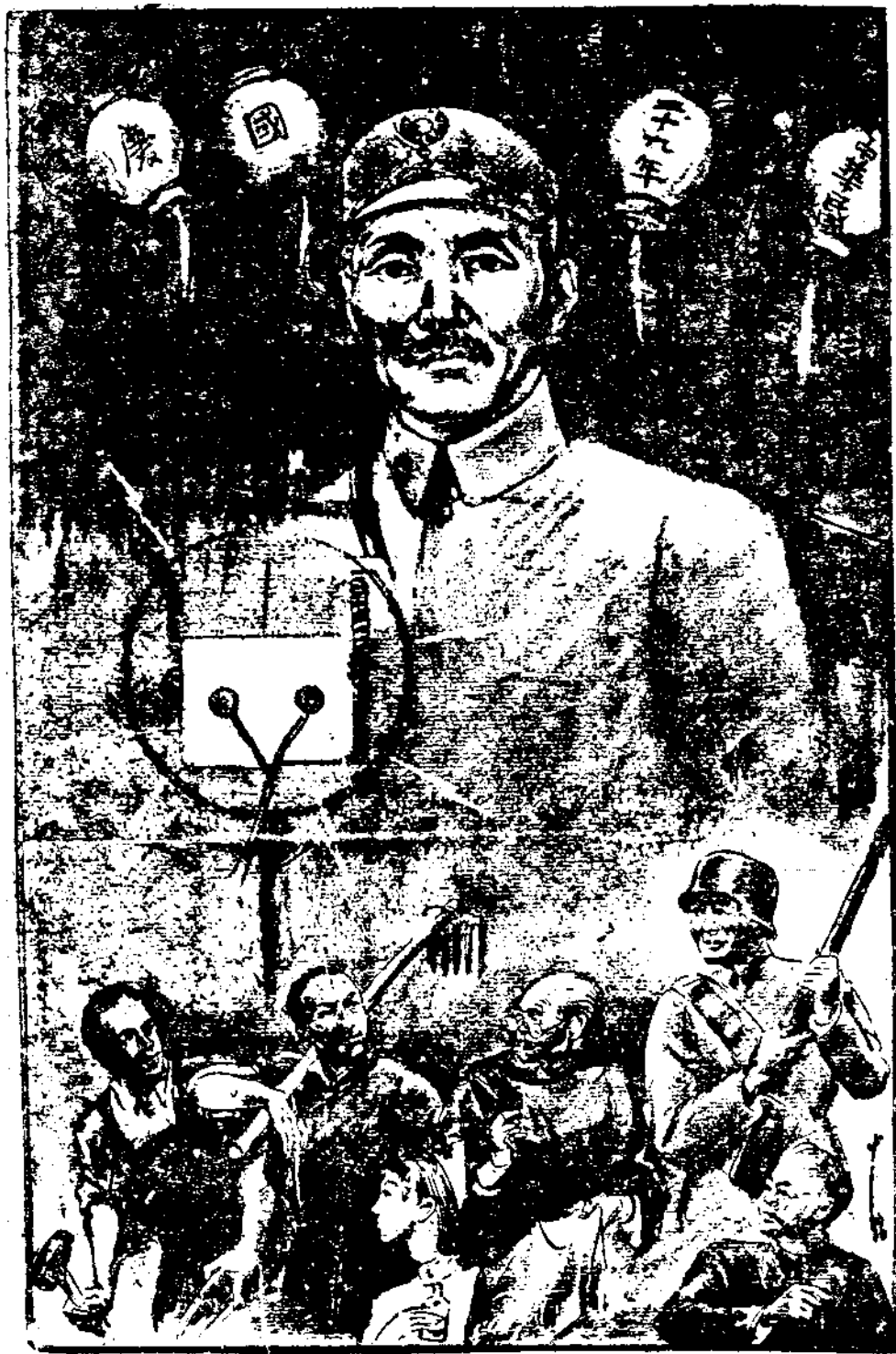
紀念國慶擁護領袖