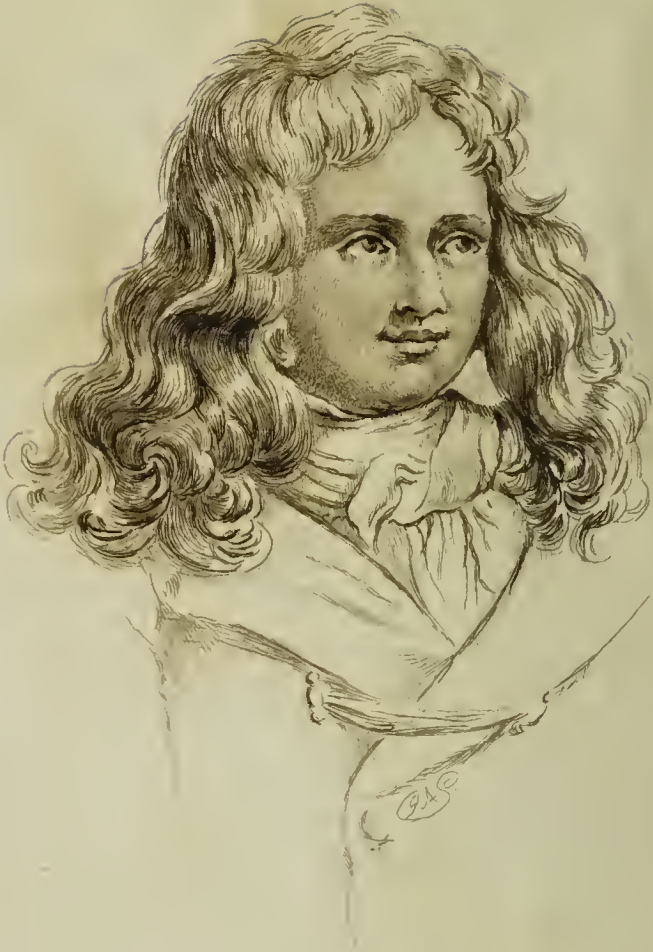
De Saint Pierre.