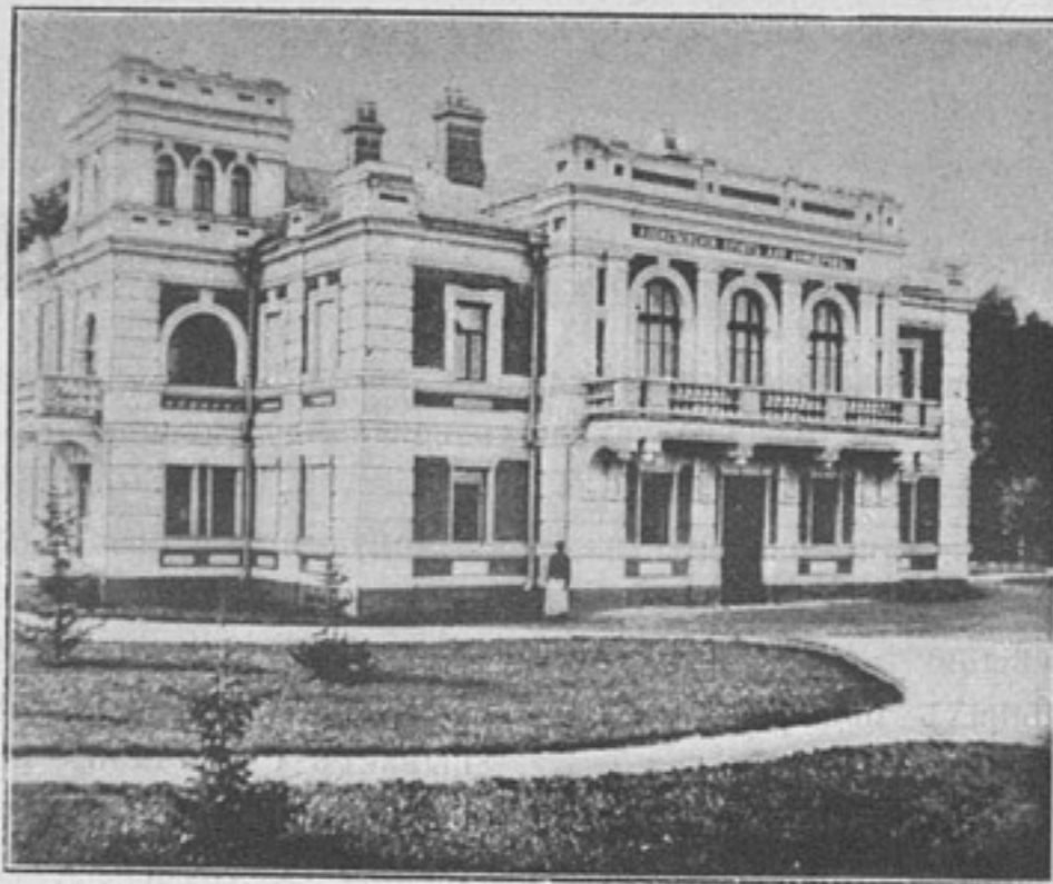
Александровскій пріютъ для офицеровъ (къ статьѣ «Александровское убѣжище увѣчныхъ воиновъ»).