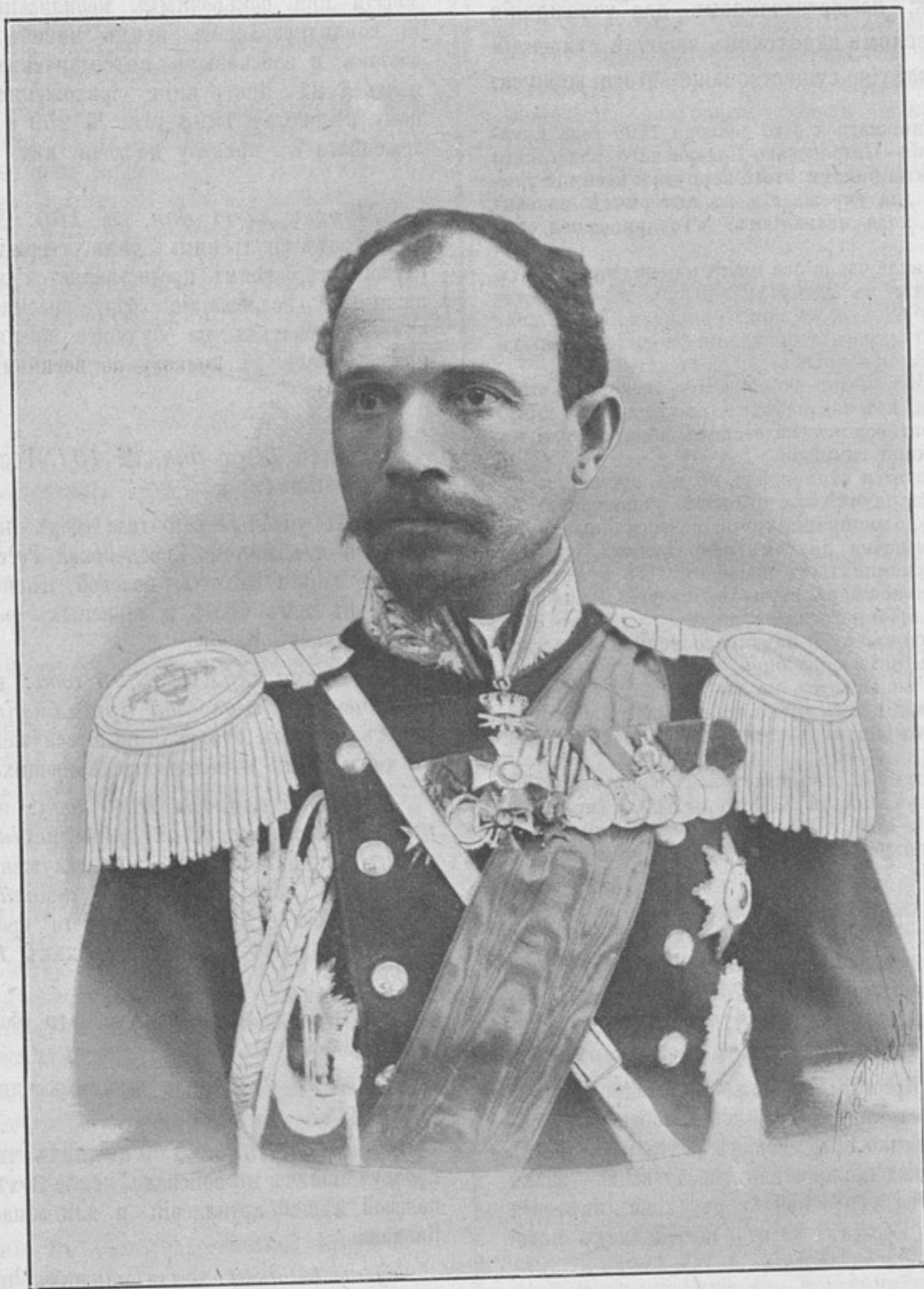
Военный Министръ Болгарскаго княжества, почетный флигель-адъютантъ, генеральнаго штаба полковникъ