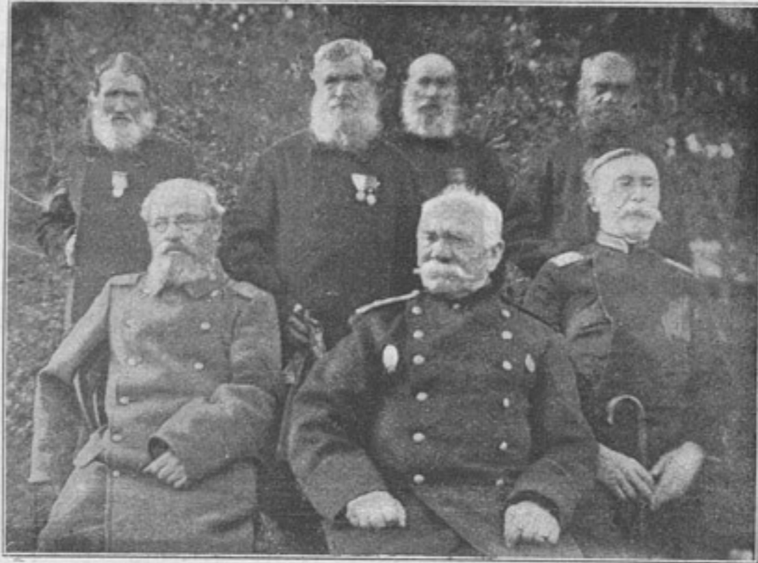
Группа пенсионеровъ Александровскаго пріюта (къ статьѣ «Александровское убѣжище увѣчныхъ воиновъ»).

Вмѣстѣ съ тѣмъ признается необходимымъ возстановить штатную должность полкового квартирмейстера и всю переписку по хозяйству возложить, какъ было прежде, на соответственныхъ чиновъ хозяйственнаго управленія, упразднивъ должность дѣлопроизводителя по хозяйственной части, при чемъ старшихъ писарей по части полкового адъютанта, казначея и квартирмейстера замѣщать сверхсрочными, назначивъ имъ соответствующее добавочное содержаніе съ періодическимъ его увеличеніемъ. Нѣтъ никакого сомнѣнія, что эти скромные труженики