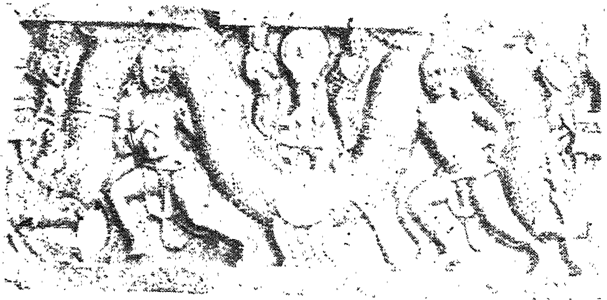
అమరావతీస్తూపము : ప్రాకారోష్ఠీపశ్చిమము

విభూతికి సూత్రములు వన్నిన ప్రాచీనాంధ్రశిల్పాచార్యులు రచించిన కృతుల గొప్పదనమునకు అమరావతి, జగ్గయ్య పేట, నాగార్జునునికొండ మొదలగుచోట్ల బయలు పడిన స్తూపము లందలి భగ్నశిథిలశిల్పశకలములె నేడు నిదర్శన ములుగ నున్నవి.