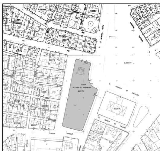
Cartográfico C.G.C.C.T 1980