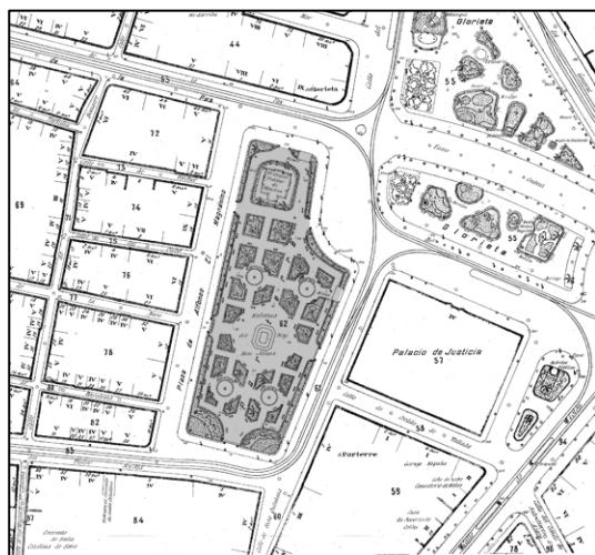
Cartográfico Municipal 1929-1945

(Página web Infocidad. Ayuntamiento de Valencia)