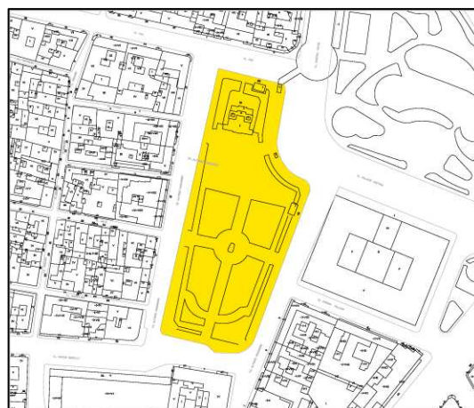
Plano Catastral 2009

NÚMERO DE EDIFICIOS: -- NÚMERO DE PLANTAS: -- OCUPACIÓN: TOTAL CONSERVACIÓN: BUENO