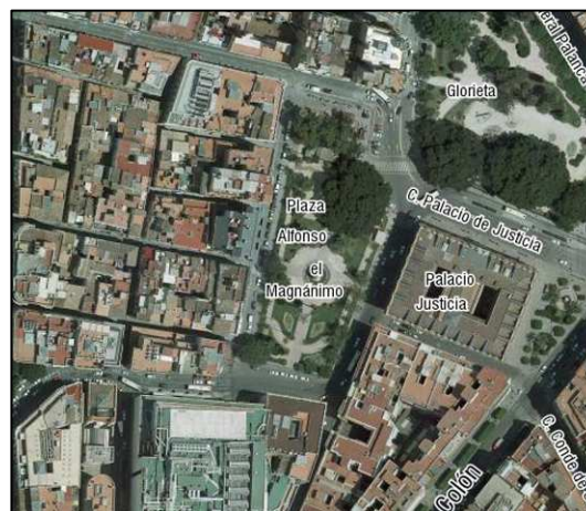
Fotografía Aérea 2008

Cartografía Catastral: -- Manzana: -- Parcela: -- CART. CATASTRAL: 401-22-III IMPLANTACIÓN: AISLADO FORMA: REGULAR SUPERFICIE: 5710 M2