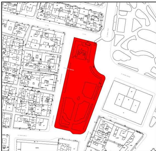
Entorno de protección. Identificación de los elementos protegidos