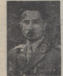
سرگرد بلوچ غرائی که اکنون مأمورین در تعقیب او می باشند

آقایان وزیر کشور، رئیس ستاد ارتش، سرپرست شهربانی و فرماندار نظامی و معاونین ایشان و ادارات تابعه شهربانی از سوی تشییع تاکنون مشغول تنظیم و اداره برنامه تشییع جنازه و مجلس ختم بودند و چون شخصاً نیز در مراسم دیروز و همچنین در مجلس ختم امروز شرکت نمودند تعقیب پرونده قتل افشار طوس و مذاکره در اطراف تهیه اعلامیه در یست و چهار ساعت گذشته متوقف گردید و شاید تأخیر در صدور اعلامیه مفصل فرمانداری نظامی نیز بسبب این امر داشته باشد.