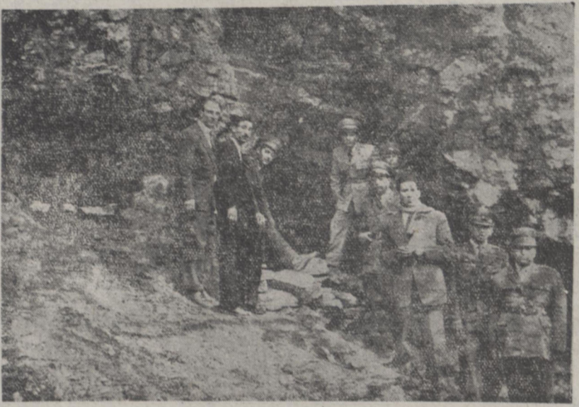
در دهانه کوههای «تلو» محلی که افشار طوس را زندانی کرده بودند دو غار وجود داشته است که در یکی از آنها مستظلمین بسر میبردند و در غار دیگر رئیس شهربانی را کتشته و چشم بسته گذارده بودند. در عکس بالا هر دو غار دیده میشود و آنجا که عده ای استاده اند همان غاری است که افشار طوس در آن پستی برده