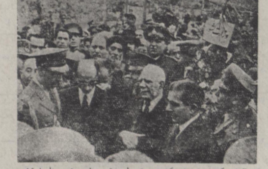
آقای دکتر صدیقی وزیر کشور و تیسار سرتیپ با سرپرست ستاد ارتش بیازمانند که مرحوم سرتیپ افشار طوس که در طرفین ایشان قرار دارند تلیت میدهند

برای تهیه دلار و ارز مطالعه می شود از چند روز قبل مجدداً در وزارت دارائی برای تهیه دلار تهارتی و ارز قابل تبدیل بدلا بر مملکتی صورت میگیرد و تدریجاً اقداماتی در این باره بعمل خواهد آمد و همانطور که قبلاً اطلاع داده شد دلار مورد مصرف خرید شتر خواهد رسید امروز در وزارت دارائی تصمیم گرفته شد که در حدود سی هزار تن جو بقیه در صفحه چهارم