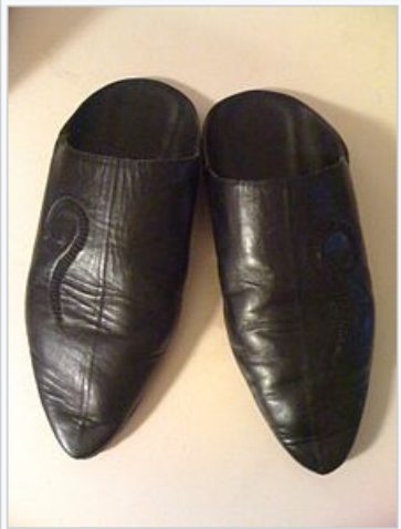
بلعة د راجل