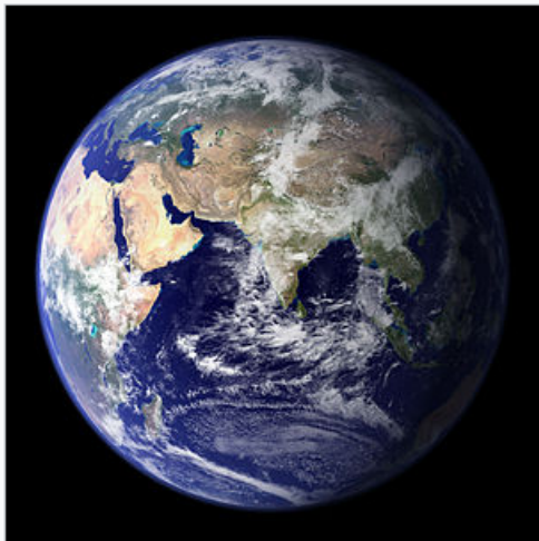
التصويرة ديال لأرض من السما