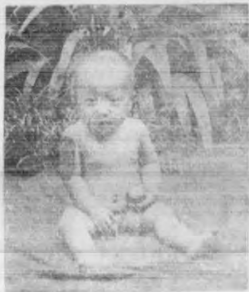
慈永 子二之文世虎