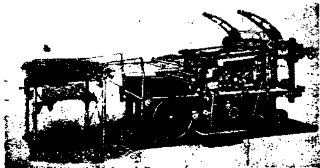
本廠自動鉛印機之一