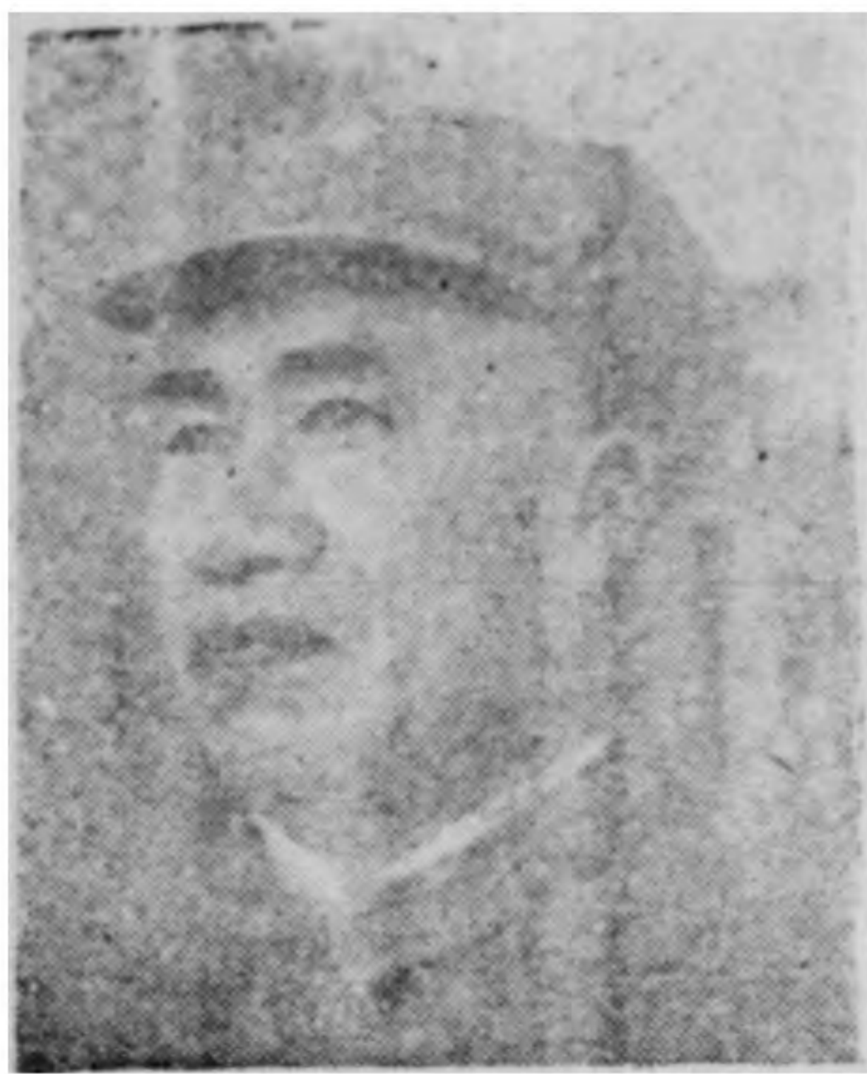
朱德節錄「論解放區戰場」

「——我們八路軍、新四軍從其前身即內戰時期的紅軍建軍以來，在毛澤東同志領導下，即具備了民族的、人民的、民主的特點，它是民族的，因為它始終站在反對侵略者的立場，具有保衛祖國，建立獨立中國的至高無上的熱情。它是人民的，因為它是從人民當中來，始終是為人民的解放和幸福而奮鬥。它是民主的，因為它是軍民一致和官兵一致，一掃軍閥制度，造成為人民的民主政治而奮鬥的工具。它的戰鬥力，它的不可戰勝，就是由於它具備了這三大特點。」