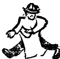
活捉送信特務一名