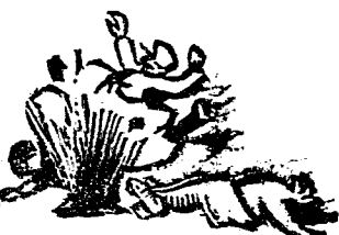
五個地雷，炸傷敵人七名，拉雷炸傷敵人十三名