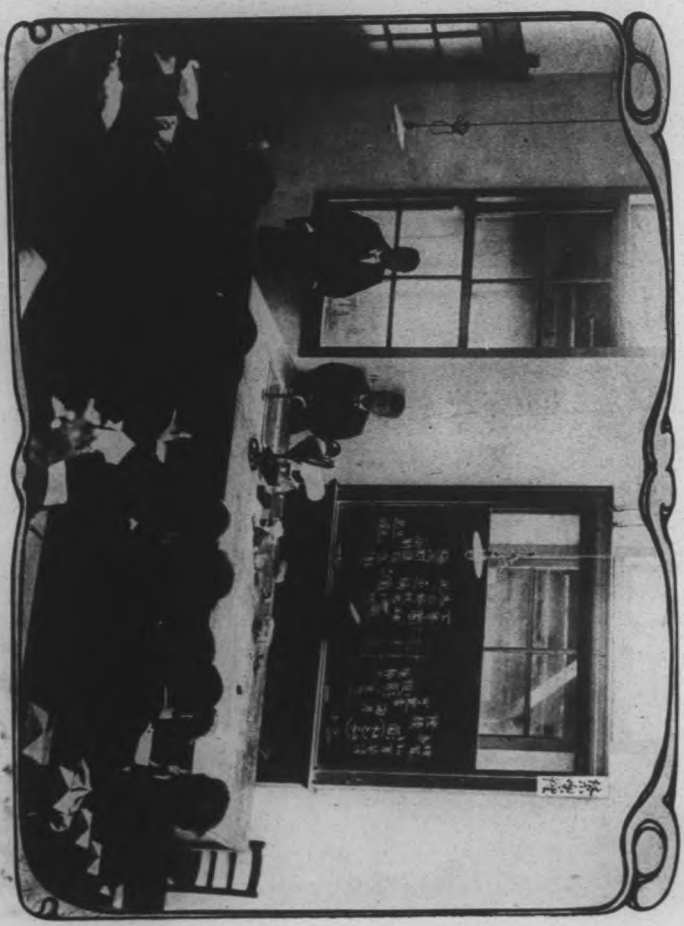
早稻大田清國留學生理科教室