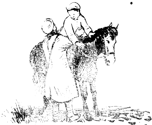
○上馬在馱子柱小把丹志劉