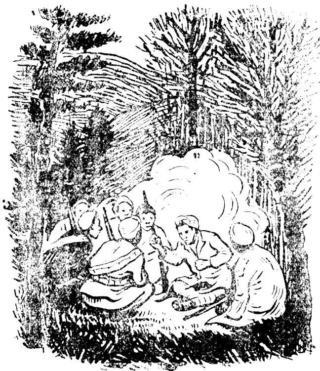
困難在們志同的他跟丹志劉

裡，眼窩凹了下去，但他沒有一點灰心，簡直像個鐵人一樣，帶着他的伙伴們，前進着，他知道，在外面有成千上萬的同志們，在等着他們，有更多的受苦的人民，還沒有翻身，尤其是，當他聽說：許多同志犧牲了，有的叫反革命活埋了，他心裡又難過又憤怒，他含着眼淚：痛罵反革命，每