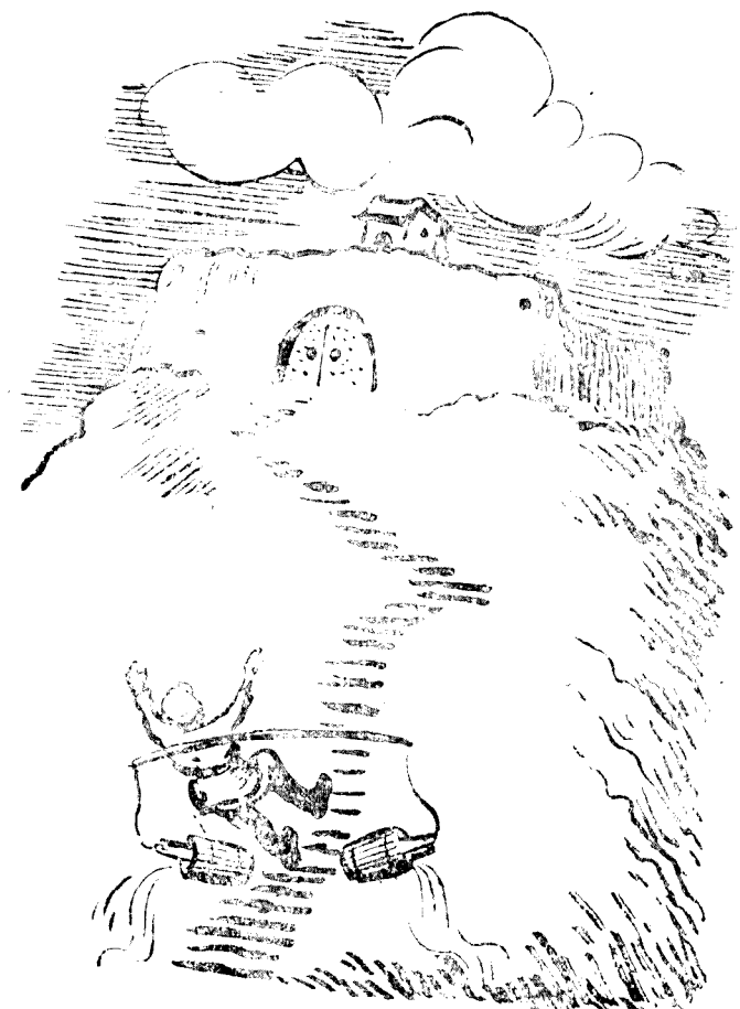
○ 來下個軍官的才搬個一，槍一