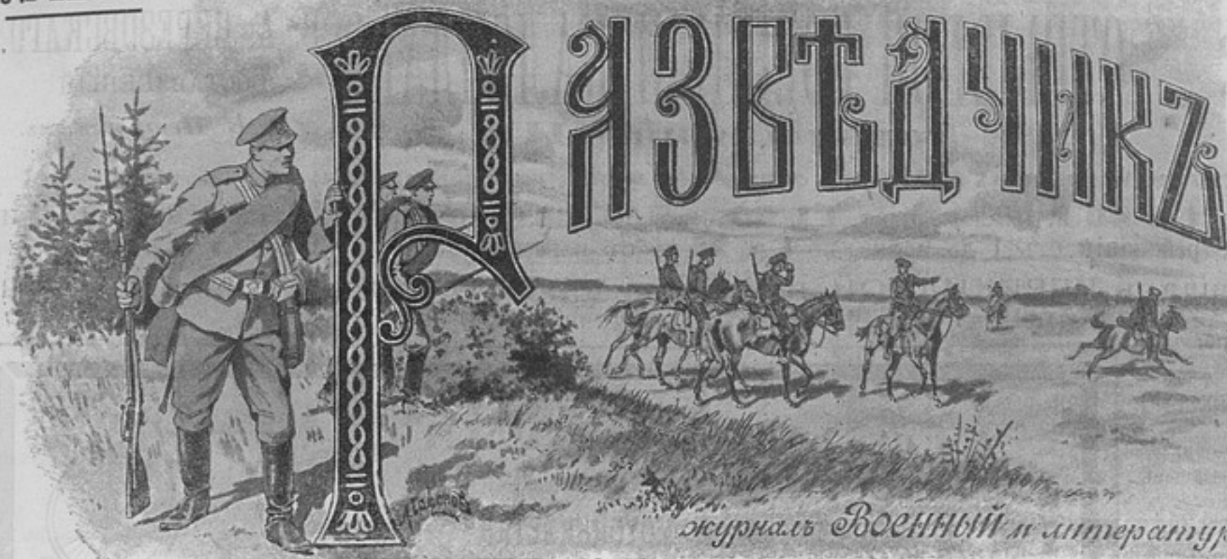
журналъ Военный и литературный.

Подписная цѣна съ доставкой и пере- сылкой на годъ. 6 руб. На 1/2 года 4 р., на 3 мѣ- сяца 2 р., за границу 8 р. Отдѣльные №№ по 15 к. За перемѣну адр. 25 к. Статьи и замѣтки должны быть за подписью и адрес. автора. Въ случаѣ надобн. статьи пе- редѣлыв. въ редакц. Для лич- ныхъ объясн. редакціи от- крыта, исключ. пражда, по вторн, четв. и пятниц. отъ 6 до 8 ч. Тел. 72-52.