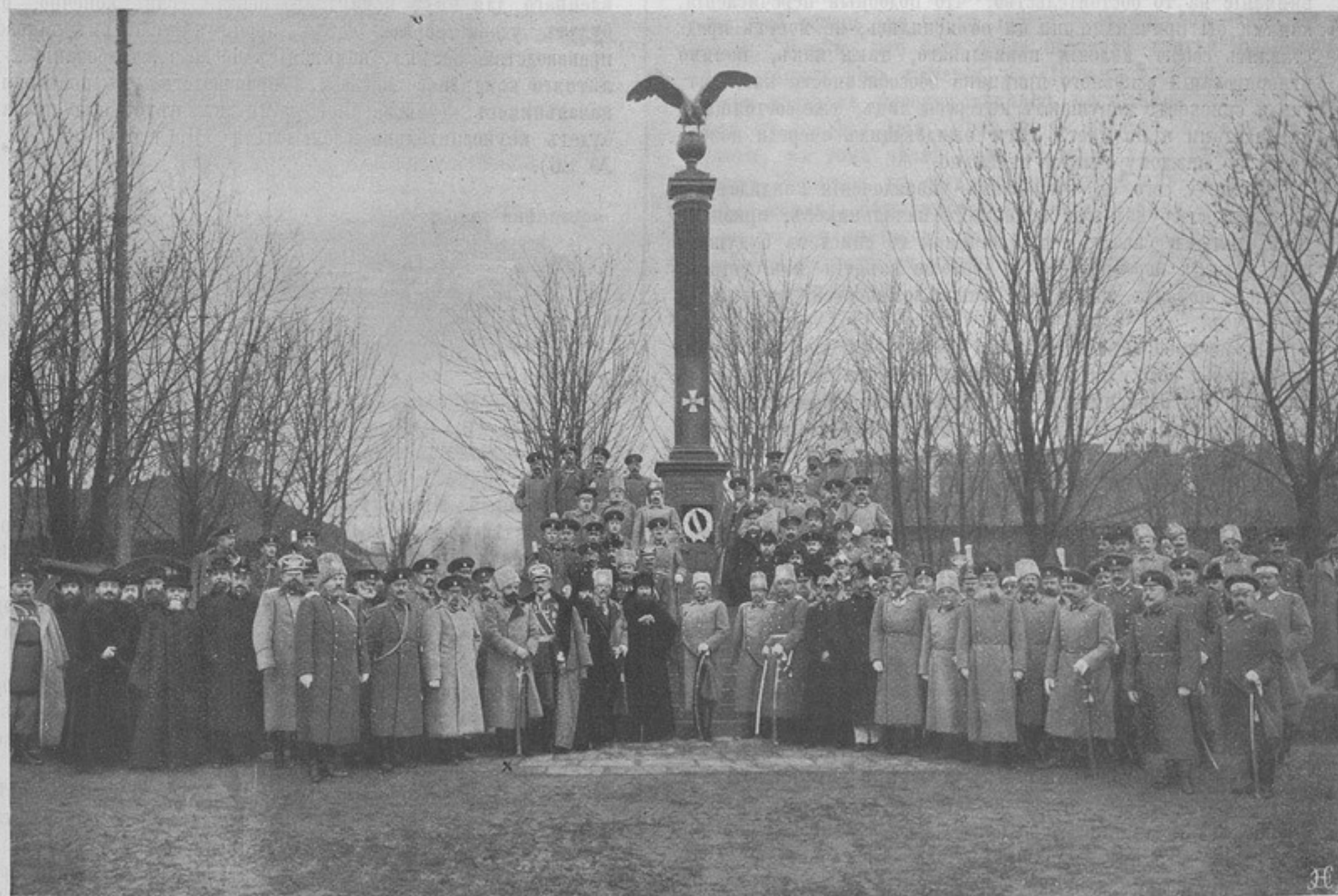
Памятникъ „Славы“ чиновъ 26-й артиллерійской бригады, открытый и освященный въ Гроднѣ 4-го ноября 1913 г. (Къ корресп. „Гродна“).

СОДЕРЖАНИЕ: Распоряженія по военному вѣдомству. — М. Н. Анненковъ. Скуларевскій . — Школоманія въ сол- вачномъ и въ лунномъ освѣщеніи. А. Дмитревскій . — Полковники въ армейскихъ полкахъ. В. Г. — Случай, когда приходится доказывать, что бѣлое есть бѣлое, а не зеленое. П. Гейманъ . — Какъ развлекаться. Я. У. Шишко . — Грустные итоги. Е. Кри- цовъ . — Реформы по части интендантской формы. П. в. — Обзоръ печати. — Корреспонденція. — Библиографія. — Фельетонъ: Пригрѣзилось. Егоръ Егоровъ . — Вопросы и отвѣты №№ 4846—4852 — Почтовый ящикъ. — Объявленія. — Высочайше приказы.