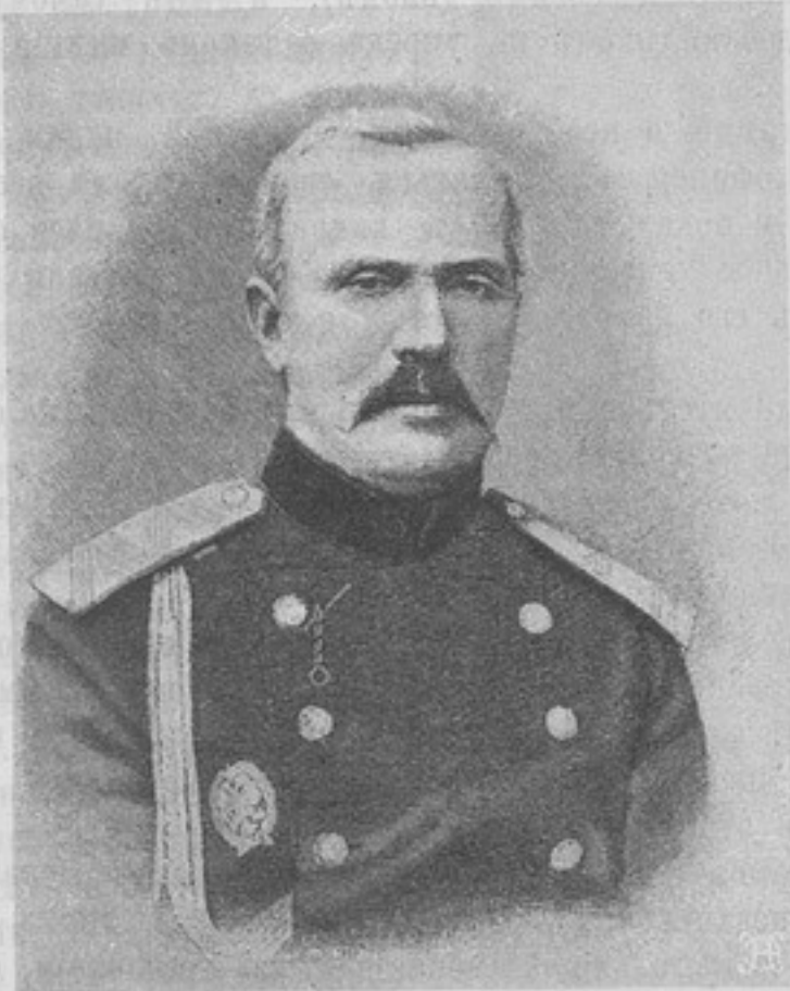
Строитель Закаспійской жел. дор., генераль-отъ-инфантеріи М. Н. Анненковъ.