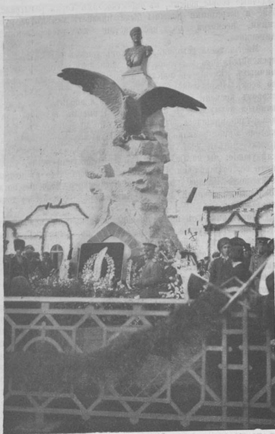
Памятникъ М. Н. Анненкову, открытый въ Самарандѣ.

ему расправить крылья, или свергнуть его съ высоты полета. Надо прямо признаться, и послѣдняя война это доказала, что въ прежнее время военная служба у насъ покровительствовала больше людямъ умѣреннымъ и угодливымъ, безъ размаха мысли, безъ инициативы въ дѣлахъ. До послѣдняго времени, какъ и сто лѣтъ тому назадъ, у насъ можно было сказать: «Молчаливые блаженствуютъ на свѣтѣ».