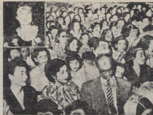
جمعی از فرهنگیان و اولیای اطفال در جشن دبستان پیشرو در طرف چپ نیومدیر آموزشگاه پیشرو گزارش دبستان را برای خاتمه مراسم میخواند

بمناسبت پایان دومین سال تحصیلی کود کستان و دبستان پیشرو در روز ساعت هفت بعد از ظهر مجلس جشنی در سالن دانشسرای مقدماتی تهران برپا گردید . در این جشن ابتدا آقای دکتر مهدی جلالی استادن دانشگاه ضمن تشکر از حضور مدعوین تاریخچه تأسیس موسسه فرهنگی پیشرو را بیان داشت و سپس خانم زما یان مدیره آموزشگاه گزارش سالانه موسسه را قرائت کرد سپس برنامه جشن آغاز گردید