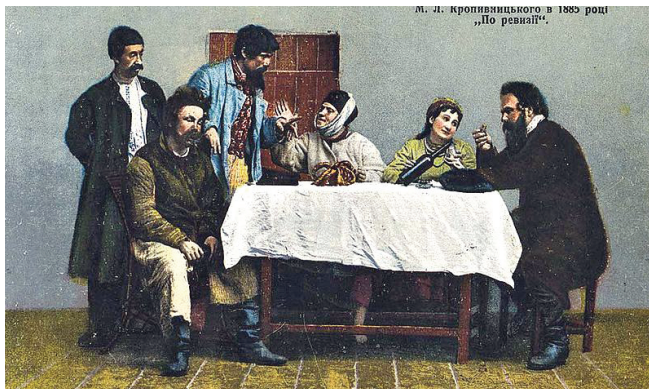
Учасники Театру корифеїв

«Кримська світлиця», № 34, 28 серпня 1993 р.