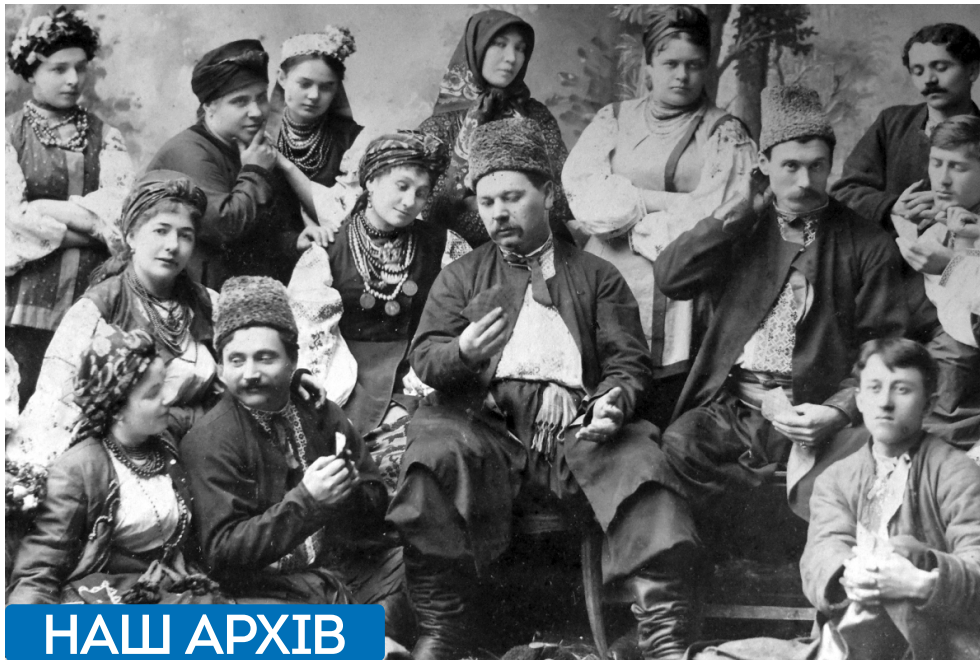
Трупа Марка Кропивницького. По центру – засновник, актор і режисер трупи Марко Кропивницький