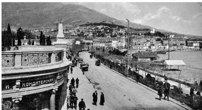
Ялта, 1933 рік, набережна