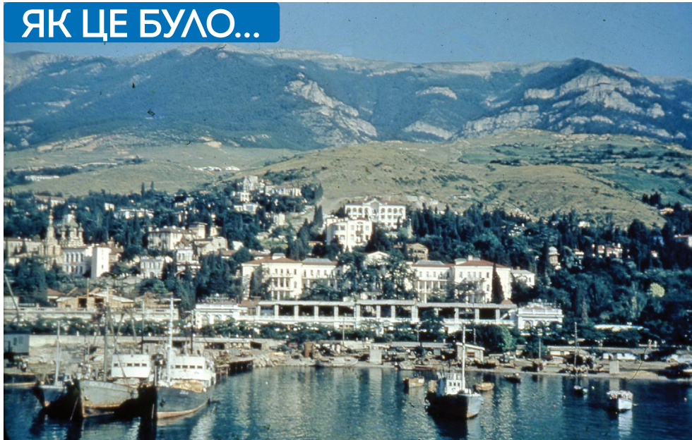
1950-ті роки – судна ялтинського рибколгоспу на тлі незабудованого міста