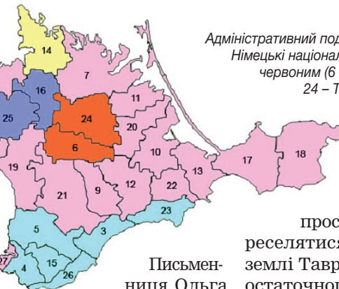
Адміністративний поділ Кримської АРСР. Німецькі національні райони виділені червоним (6 – Біюк-Онларський, 24 – Тельманський (центр Курман-Кемельчи));

Німці – не просто один з народів, що пустив пагони по всьому світі. Німці скрізь, де жили, завжди завойовували повагу в інших народів і ставали прикладом для тих народів. І в Україні також.