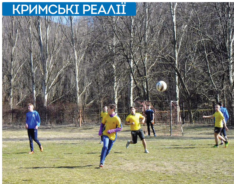
«Екстремістський» футбольний матч у Краснокам'янці. 04.03.2017 р.

Паралелей можна провести безліч. Скажімо, навести за приклад геополітичну катастрофу, яка сталася у най-