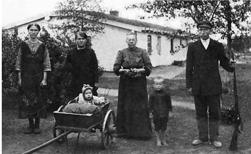
Німці до депортації

Готи панували у Північному Причорномор'ї з III століття по Різду Христовому. Достеменно відомо, що Феодоро, держава, яка існувала в XII-XV століттях у Криму, була населена людьми візантійської релігії, котрі розмовляли мовою, вельми подібною до німецької. Відомості про це збереглися завдяки західному дипломату де Бусбеку, котрий у 1562 році записав пісно готською мовою та 96 слів, почутих від готів з Феодоро, з якими він спілкувався у Константинополі. Апель (яблуко), хус (дім), ханда (рука) – слова, схожі на відповідні німецькі та англійські, а насамперед – на шведські. Але це вже було після падіння Феодоро, після того, як турки знищили 15 тисяч мангупців. Від XVII століття згадок про готську мову немає, хоча готи згадуються.