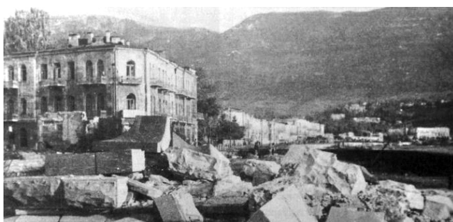
Набережна Ялти під час війни, 1944 р.

Його розташували у мальовничій місцевості між Ведмідь-Горою (Аю-Дагом) і Гурзуфом. Уже після передачі Кримської області Україні, завдяки постійній партійній увазі, «Артек» перетвориться у потужний Міжнародний дитячий оздоровчо-виховний мегаполіс.