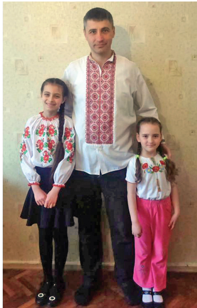
ФОТО З ВІДКРИТІХ ДЖЕМІЛ