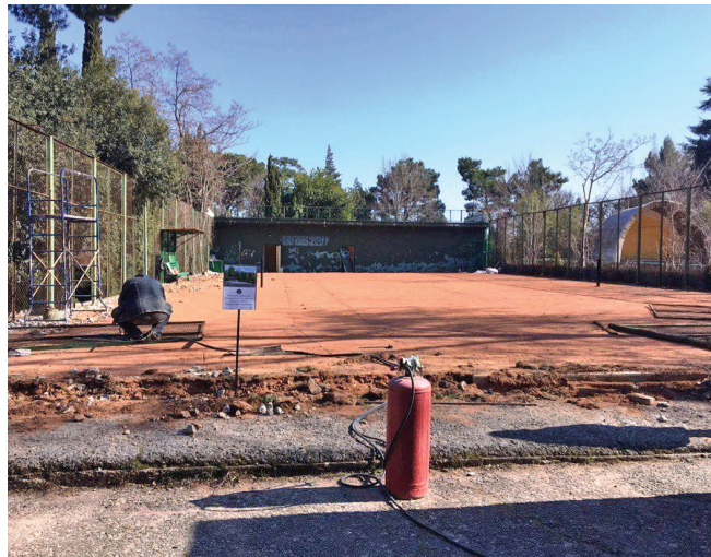
Демонтаж тенісного корту в Лівадії під встановлення пам'ятника цареві Олександрові III. 09.03.2017 р.

14 березня біля всіх входів до ялтинського військового санаторію на вулиці Свердлова, який належав Міністерству оборони України і який після окупації Криму загарбало російське МО, з'явилися «ввічливі чоловічки» у формі, без розпізнавальних знаків і з закритими обличчями. До складу санаторію силовим методом було долучено прилеглу до нього територію, яка до окупації Криму перебувала у приватній власності і на якій розташовувалися торговельно-розважальні заклади; орендарям дали буквально три дні на звільнення території, яка стане закритим режимним об'єктом. Таким чином мешканці доволішніх районів залишилися не лише без парку, а й без футбольного поля, на якому тренувалися місцеві спортсмени і відбувалися міські чемпіонати: ще у 2009 році стадіон був переданий у безоплатне користування ялтинському управлінню з фізичної культури та спорту. Провідний же ялтинський стадіон «Авангард» з вересня обіцяють закрити на реконструкцію.