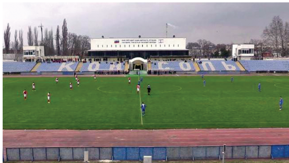
«Свято футболу» в Сімферополі при порожніх трибунах. 16.03.2017 р.

З 2016 року в одній з будівель на території санаторію МО розташовувався тренажерний зал, а також проводилися фітнес-тренування і діяла школа бойових мистецтв для дорослих і дітей, якій, за словами ялтинців, у місті не було рівних. Приміщення, яке тривалий час стояло пустою, небайдужі спортсмени відремонтували, надавши можливість мешканцям найближчих не лише вулиць, а й селищ займатися спортом недалеко від дому. «Визволителі» покладали цьому край. В обговореннях новини про унеможливлення користування територією та інфраструктурою санаторію ялтинці шукають відповіді на запитання – що робити тим, хто не бачить радості в алкоголі, і що взагалі доброго для них зробила місцева «влада», крім пластмасових одноразових дитячих майданчиків.