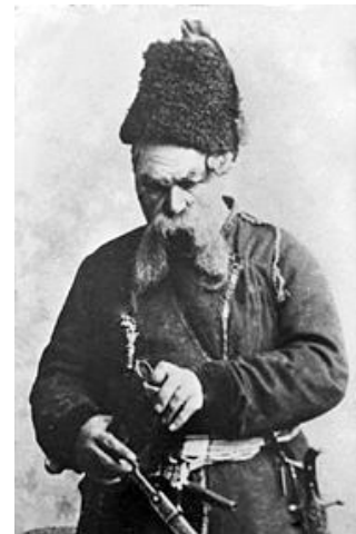
М. Кропивницький у ролі Тараса Бульби

артистів – П. К.) поповнюються всякого роду невдахами і п'яницями обох статей...». У 1886 році М. Кропивницький вдруге прибуває до Криму у складі трупи М. Старицького, яка гастролувала в Севастополі майже увесь вересень. Ще до гастролей рецензент «Севастопольського листка» повідомляв, що спектаклі передбачаються надзвичайно цікаві, оскільки в них бере участь один із найвидатніших українських артистів М. Кропивницький. Високо оцінюючи його майстерність, рецензент і глядачі буквально милувалися образом Шпоньки із комедії М. Старицького «Як ковбаса та чарка, то минеться й сварка», якого Кропивницький зіграв, як зазначала преса, незрівнянно. «Передати словами всю викінченість цього виконання неможливо, потрібно бачити це майстерне змалювання кожної деталі, вірність інтонації, комізм висловів у найбільш осмисленій формі, щоб зрозуміти, наскільки п. Кропивницький майстер своєї справи і талановитий артист. Театр був до того переповнений, що виникла потреба приставних стільців». У 1889, 1891, 1896 роках М. Кропивницький прибуває до Криму вже із власною трупою, до складу якої входило багато відомих тоді артистів, зокрема,