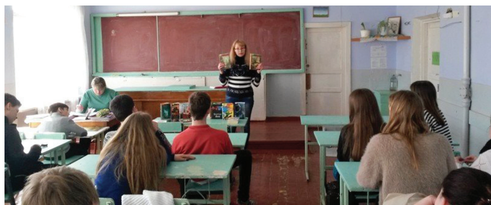
Керченські школярі знайомляться з жанром антиутопії

південнішому українському регіоні взимку-навесні 2014 року і перетворила його на «королівство, що живе за чужими для людей законами» та заразила його мешканців агресією і недовірою. Відтак дітям і юнакам, щоб зберегти себе, пізнати істину і збагнути власну сутність, лишається єдине: переміщення до вільної території країни, в якій вони народилися.