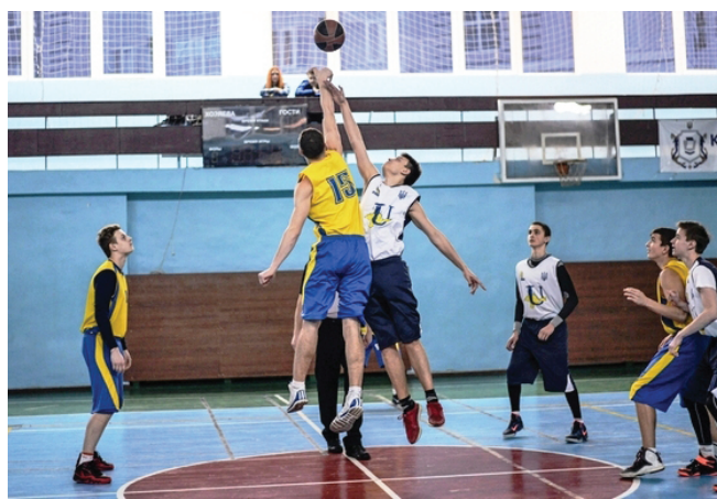
Кримські молоді баскетболісти