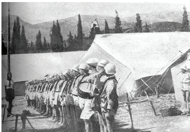
Лінійка в Артеку, 1925 р.