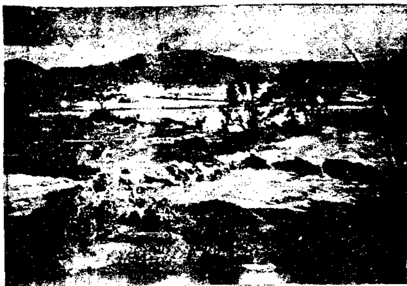
(上) 台山白沙水災保德園禾田被沙淹覆