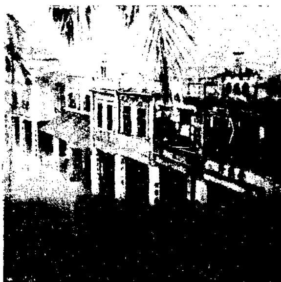
(右) 台山新昌水災被漫淹商店情形